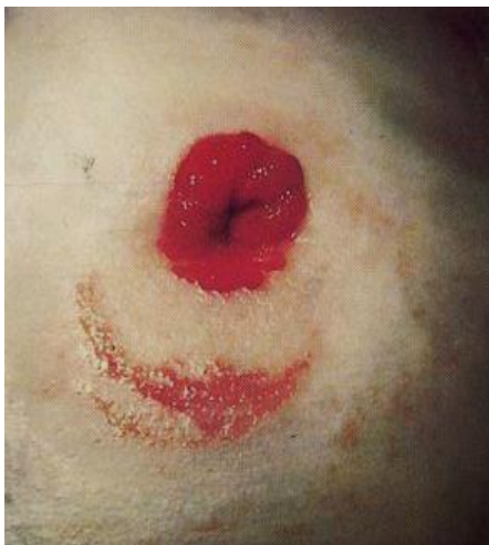
Slika 6. Mehaničko oštećenje peristomalne kože, www.shieldhealthcare.com ,2016.