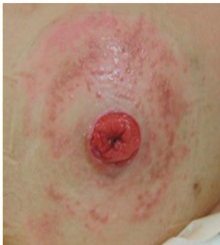
Slika 4. Kontaktni dermatitis, www.shieldhealthcare.com ,2016.