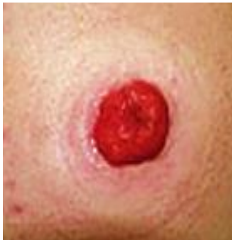
Slika 3. Urostoma AJN, 2019.

Normalna urostoma svijetlo je crvene boje, svilenkaste teksture, izdiže se iznad razine kože od jedan do tri centimetra, površina joj je topla, vlažna i bezbolna. Veličina urostome je promjenjiva, posebice prvih mjesec dana nakon operacije zbog prisutnosti postoperativnog edema. U lumen urostome postavljene su dvije tanke proteze duge 10 – 15 centimetara.