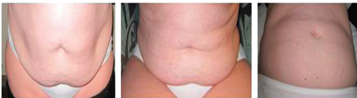
Slika 2. Položaji bolesnika pri predoperativnom obilježavanju mjesta urostome, Assessment and Care from the 2014 WCET International Ostomy Guideline, 2014.

Prednosti predoperativnog obilježavanja mjesta urostome su: