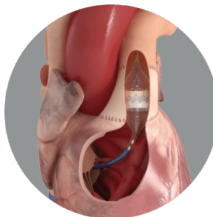
Slika 4. Edward Sapien XT zalistak