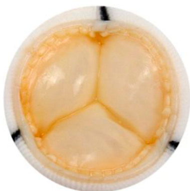
Slika 1: Bioprotetski pulmonalni zalistak

Kirurška zamjena pulmonalnog zalistka povezana je s malim operativnim morbiditetom i smrtnošću i pokazuje vrlo dobre dugoročne rezultate (14).