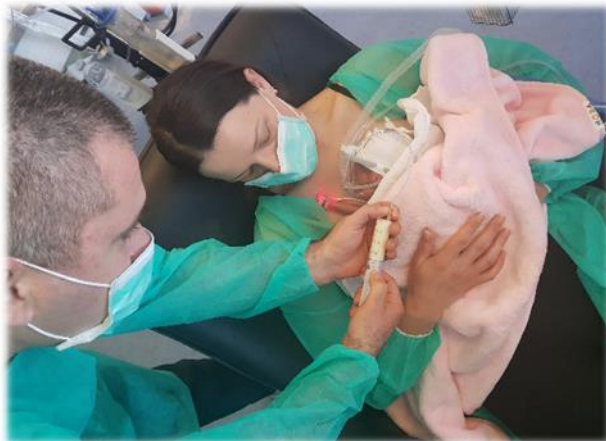
Slika 3. Otac hrani dijete putem želučane sonde za vrijeme provođenja klockanske skrbi

Poželjno je od samoga početka roditeljima objasniti i na praktičan način pokazati kako se njihovo dijete hrani te ih potaknuti i uključiti u postupak hranjenja. Poželjno je roditeljima dati edukativne pisane ili video materijale. Roditelji će možda u početku biti uplašeni, stoga ih treba ohrabriti i motivirati. Medicinske sestre trebaju procjenjivati roditelje i dati im vremena u svladavanju potrebnih vještina. Čim roditelji usvoje tehniku hranjenja, treba ih potaknuti da potpuno preuzmu tu ulogu kada su prisutni uz dijete kako bi se osjećali korisnima (slika 3). Očevima to predstavlja posebno zadovoljstvo jer cijene priliku da i oni mogu učiniti nešto za svoje dijete.