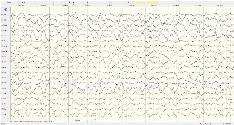
Slika 1. EEG: osnovna cerebralna aktivnost theta frekvencije, uz koju se interponiraju sporije aktivnosti i polimorfne delta aktivnosti.