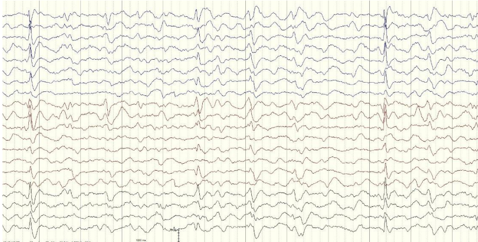
Slika 3. EEG 5. dan bolesti: atenuirana osnovna cerebralna aktivnost što može biti posljedica sedacije, manje učestala pojava periodičnih generaliziranih epileptiformnih izbijanja.