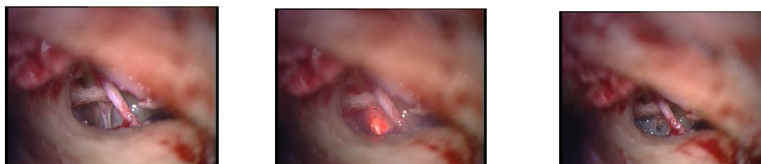
Slika 2. Slika prikazuje pogled u srednje uho. Laserskom zrakom prerezana je tetiva m.stapediusa i stražnji krak stapesa te je prikazana pločica stapesa.

Na pločici stapesa preklapajućim laserskim hicima stvara se otvor veličine 0,6 – 0,8 mm u uzorku rozete, a razmak između tih pulseva trebao bi biti dvije to tri sekunde kako bi se izbjegao nekontrolirani porast temperature (51). Otvor u pločici stapesa može se načini i jednim udarom lasera (engl. one-shot technique), koristeći posebne softverske sustave povezane s laserskim uređajem (SurgiTouch Scanner) (57). Uporabom takve tehnologije, pomoću ugrađenog mikroprocesora stvara se savršeno kružna stapedotomija veličine 0,5 – 0,7 mm. U otvor se zatim smješta proteza kako je već opisano.