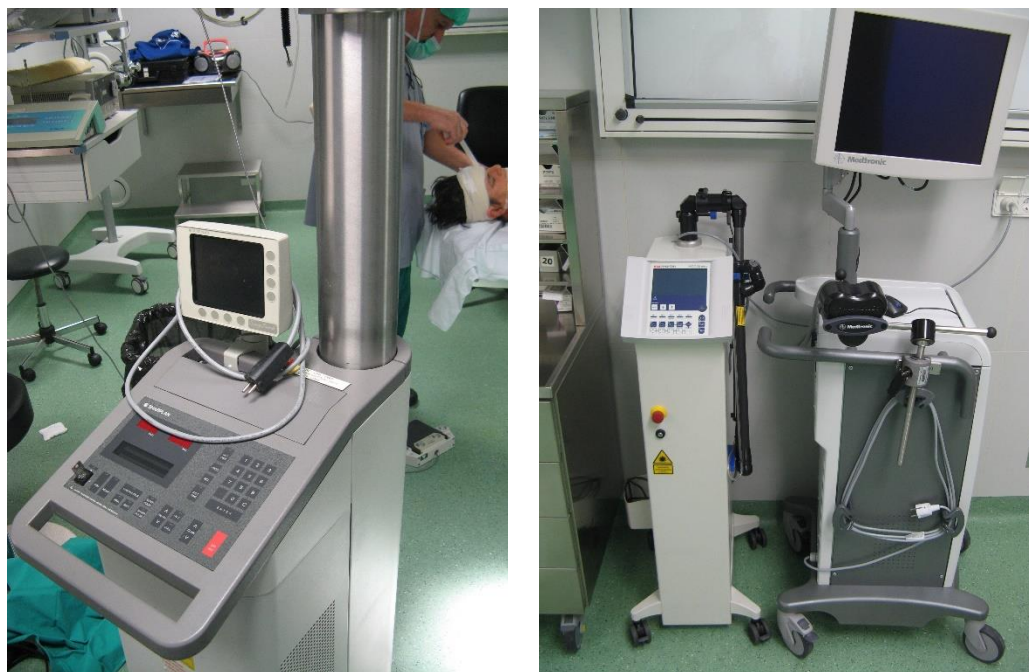
Slika 1. Laserski sustav koji se koristi u kirurgiji srednjeg uha

U kirurgiji tri najznačajnija efekta laserske zrake su rezanje tkiva, njegova koagulacija te vaporizacija. Ti različiti učinci postižu se mijenjanjem promjera laserske zrake, njezine snage te trajanja pulsa (51). Gustoća snage je obrnuto proporcionalna promjeru zrake što znači da će se smanjivanjem veličine laserske zrake povećati gustoća snage laserskog zračenja na određenom mjestu. Rezanje tkiva zahtijeva najveću gustoću snage, dok je za koagulaciju potrebna defokusirana zraka s manjom gustoćom snage. Laserska zraka može se dostaviti na željeno mjesto putem mikromanipulatora, uređaja koji je fiksiran na mikroskop pomoću kojeg se zraka i usmjerava. Drugi način je putem posebnih fiberoptičkih kablova koji napuštaju laserski sustav, a u ruci se drže kao i ostali otološki instrumenti (51).