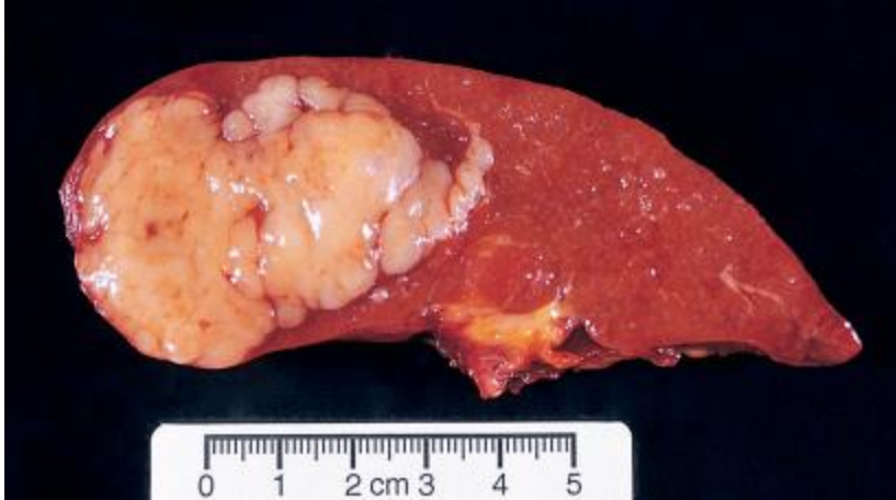
Slika 4. DLBCL koji zahvaća slezenu.