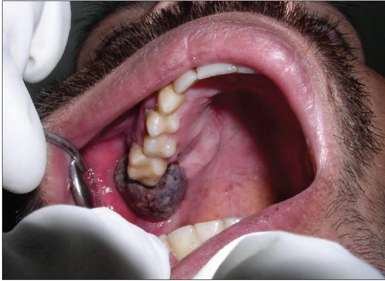
Slika 2. Burkittov limfom u desnoj maksilarnoj molarnoj regiji. Pacijent je 42-godišnji muškarac kojemu je to bila prva manifestacija HIV infekcije. Prema (34)