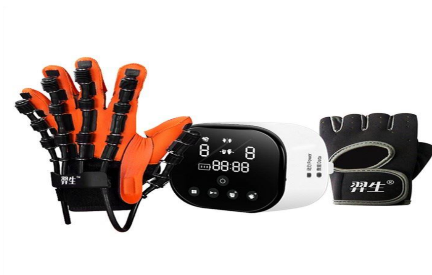
Slika 2. Mekana robotska rukavica (nosivi egzoskelet) (99)

Interakcija s okolinom odvija se uglavnom kroz ruke te se stvaraju somatosenzorne povratne informacije. Međutim, somatosenzorna funkcija je često oštećena nakon oštećenja SŽS-a. Stoga bi uređaji za neurorehabilitaciju gornjeg ekstremiteta trebali trenirati funkciju šake i prstiju te istovremeno pružati vizualnu i taktilnu povratnu informaciju (83). Terapija bi trebala uključivati zadatke koji su funkcionalno relevantni za ADL, kao što je hvatanje i otpuštanje objekata s prikazanom virtualnom dinamikom kako bi se također trenirale somatosenzorne funkcije i senzomotorna integracija (100). Primjena video igara koje su temeljene na virtualnoj realnosti bi također mogle imati značajan utjecaj na rehabilitaciju funkcije gornjih udova (61).