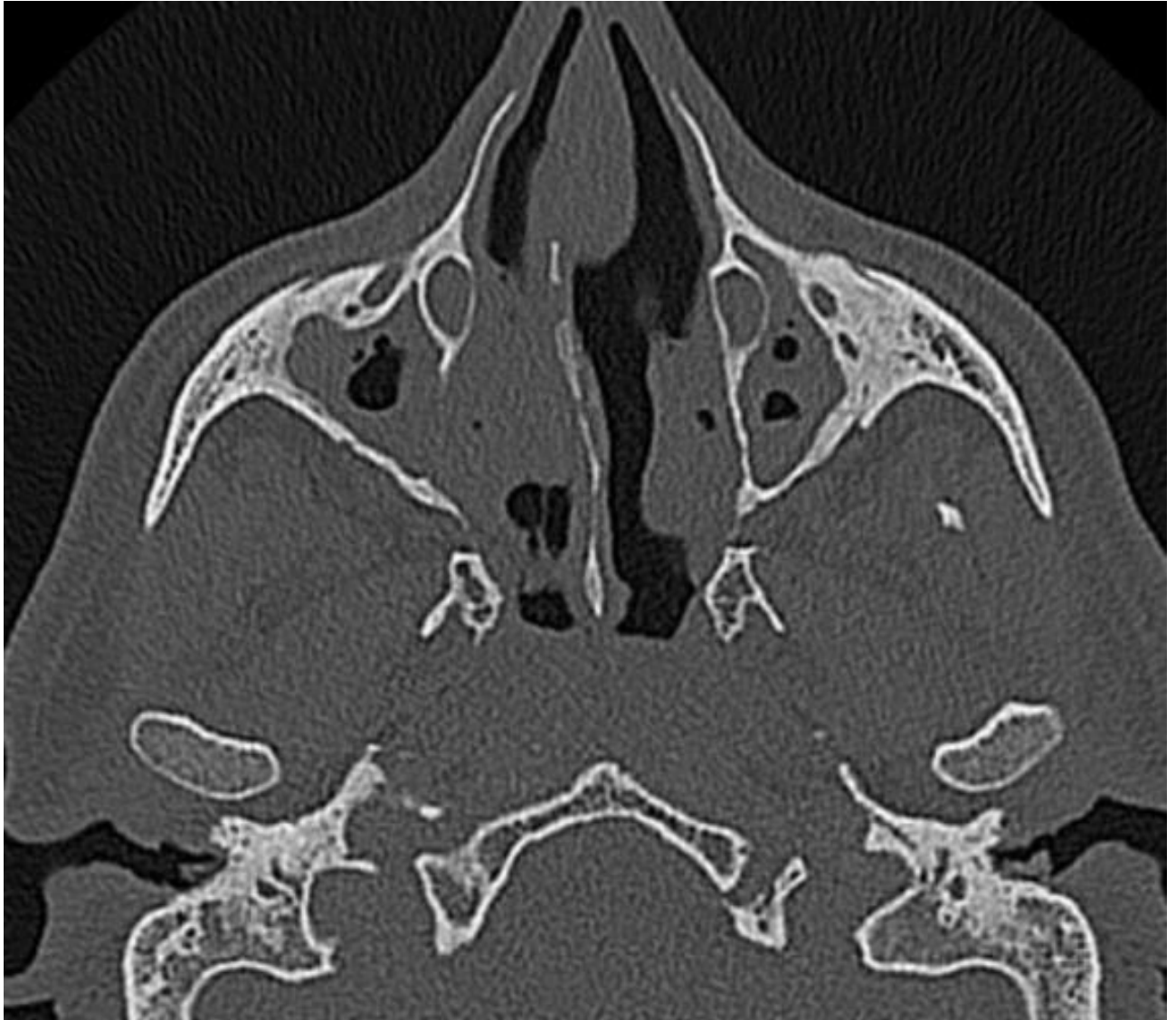
Slika 3. CT snimka nosne šupljine i paranazalnih sinusa na kojoj su oba maksilarna sinusa gotovo potpuno začepljena. Prema El-Feky, Mostafa (2019), preuzeto s:

https://radiopaedia.org/cases/chronic-rhinosinusitis?lang=gb (20)