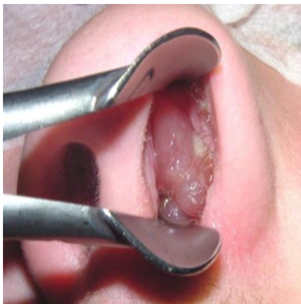
Slika 1. Prikaz velikih nosnih polipa vidljivih u lijevoj nosnici. Prema Hopkins i sur. (2021), preuzeto s

https://www.rhinologyjournal.com/Documents/Supplements/Supplement_30.pdf (3)