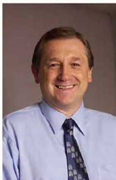
NCI Bethesda, 2002 Head, GVHD and autoimmunity