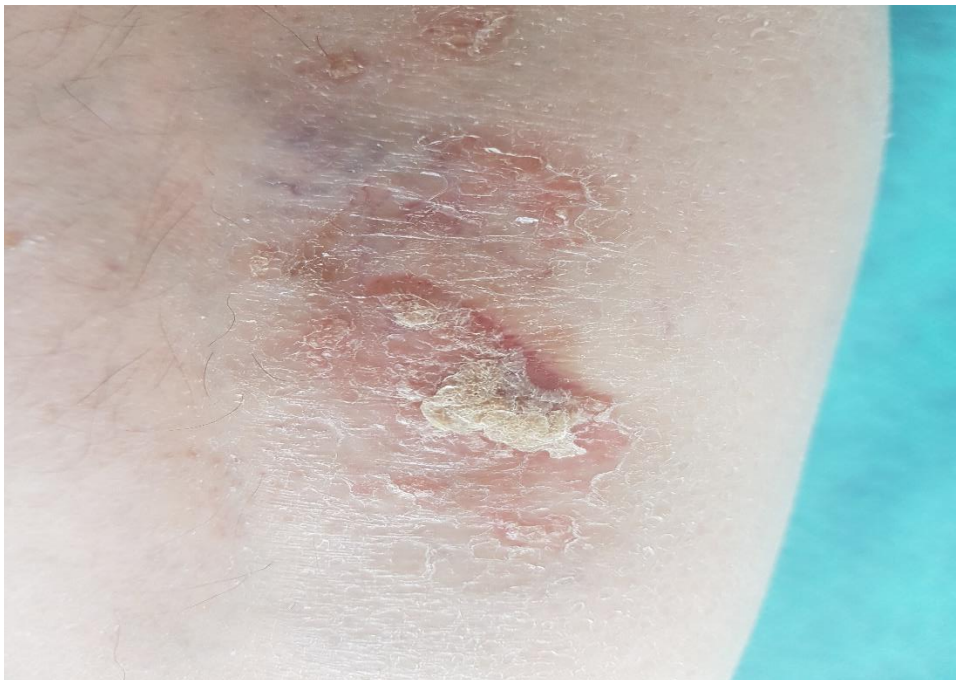
Slika 4. Promjene na koži

Za procjenu težine promjena na koži koristi se indeks PASI (65). To je danas najčešće korištena mjera u svakodnevnoj kliničkoj praksi koja prilikom procjene u obzir uzima postotak površine kože zahvaćene psorijatičnim promjenama (Area) i stupanj njihove težine (Severity). Vrednuje se stupanj crvenila, debljina psorijatičnog plaka i ljuškanja na skali od 0 do 4 (0 – odsutnost promjene, 1- blagi, 2 – umjereni, 3 – teži, 4 – najteži oblik bolesti). Ove vrijednosti se određuju posebno za određene dijelove kože tijela: glava, trup, ruke i noge, te se na kraju zbrajaju. Zatim se ti pojedinačni rezultati množe s postotkom zahvaćenosti kože pripadajućeg dijela tijela, koji se boduje od 0 do 6 (0= 0%; 1= <10%; 2= 10 - <30%; 3= 30 - <50%; 4= 50 - <70%; 5= 70 - <90%; 6= 90 – 100%), te još i s iznosom od 0.1 za područje glave, 0.2 za ruke, 0.3 za trup i 0.4 za noge. Na kraju, dobiveni iznosi se zbrajaju kako bi se dobio konačan rezultat. Minimalna vrijednost PASI-a je 0 i označava stanje bez bolesti, a maksimalna 72, pri čemu treba napomenuti da već PASI vrijednost iznad 10 označava tešku psorijazu (66).