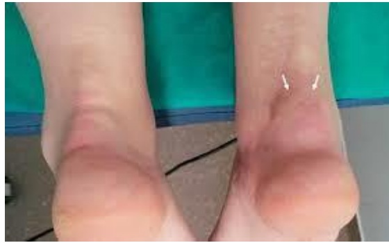
Slika 2. Entezitis Ahilove tetive

Češće su zahvaćeni donji ekstremiteti. Osjetljivost nad entezom rijetko praćena oteklinom može uzrokovati intenzivnu bol. Smatra se da je ozbiljnost entezitisa marker proliferativnih i erozivnih značajki, kao što su ankiloza zglobova, artritis mutilans i periostitis (36).