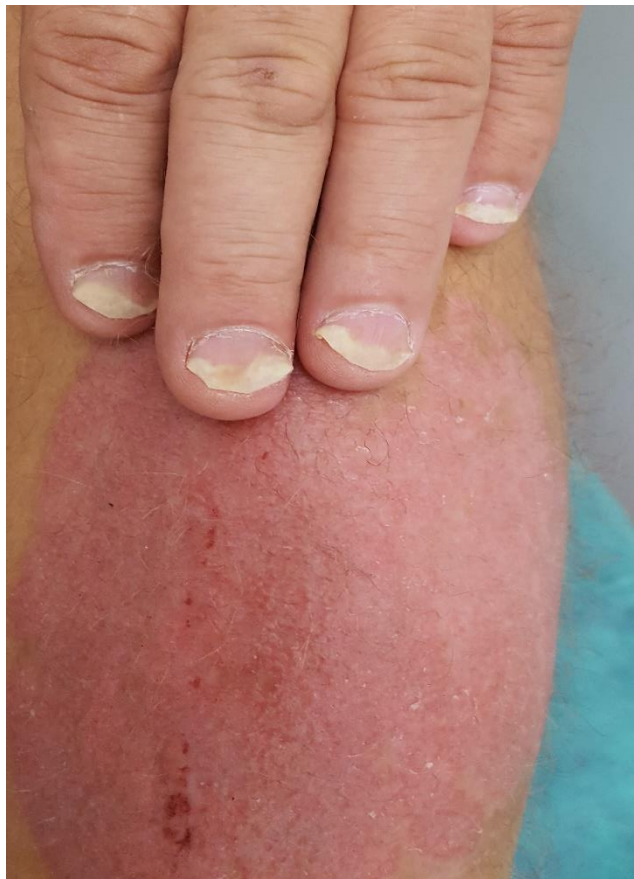
Slika 5. Promjene na koži i noktima

Kod bilo kakvih promjena na noktima u kliničkoj procjeni danas se najčešće koristi NAPSI test gdje je nokat topografski podijeljen na četiri kvadranta koja se vrednuju jednim bodom ako postoje promjene na nokatnoj ploči i dodatno još jednim bodom ako su promjene prisutne na nokatnoj matici (matriksu) sukladno kvadrantu na kojem se nalaze. Maksimalan broj bodova po noktu je 8, odnosno 160 bodova ako se uzmu u obzir nokti na donjim i gornjim ekstremitetima (69).