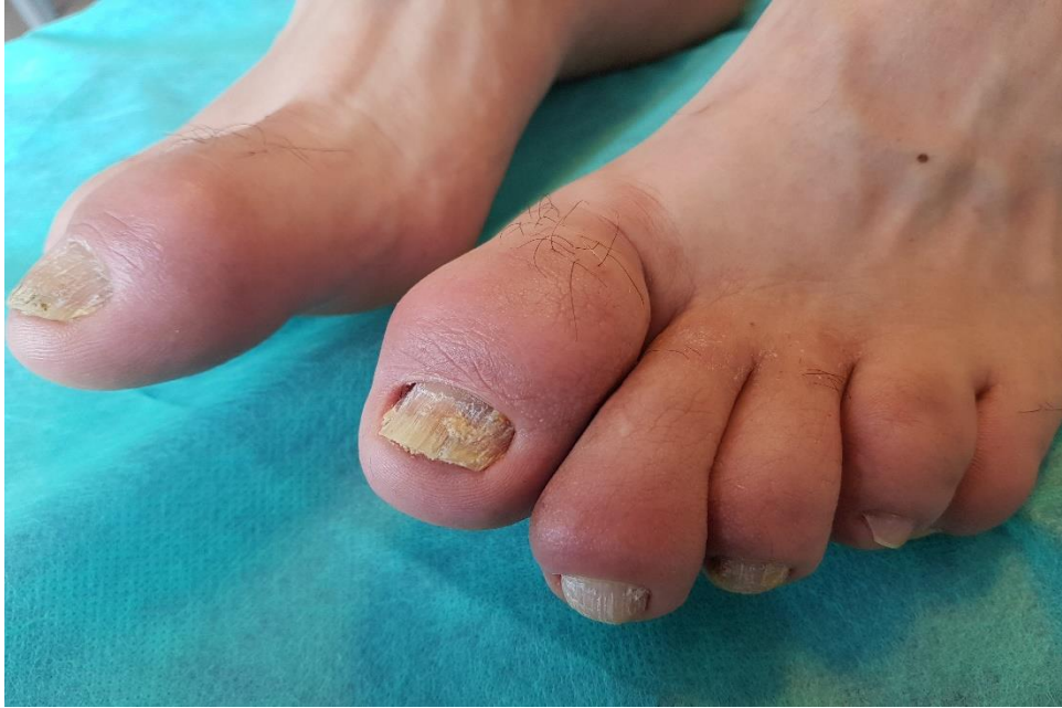
Slika 3. Daktilitis i promjene na noktima