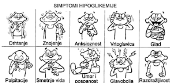
Slika 1. Simptomi hipoglikemije