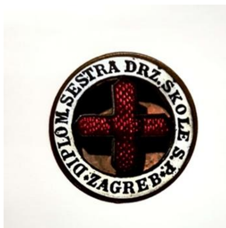
Slika 6. Broš diplomiranih sestara iz 1922. godine

Sastavni dio uniforme sestre bila je značka koja je sadržavala točno određene simbole i tekst koji je opisivao i potvrđivao status osobe koja ju nosi.