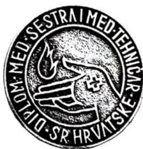
Slika 10. Broš nagrađivanih sestara

Broš su dobivale medicinske sestre koje su završile Višu školu za sestre u trajanju od tri godine (od 1956. do 1961. godine). Okruglog je oblika s valovitim rubnim djelom. Na prednjoj strani nalaze se četiri crteža koja se međusobno dodiruju, a prikazuju lik medicinske sestre na vrhu, kuću, seljaka koji kosi te majku koja doji dijete. Na brošu stoji natpis: VIŠA ŠKOLA ZA SESTRE MEDICINSKI FAKULTET ZAGREB.