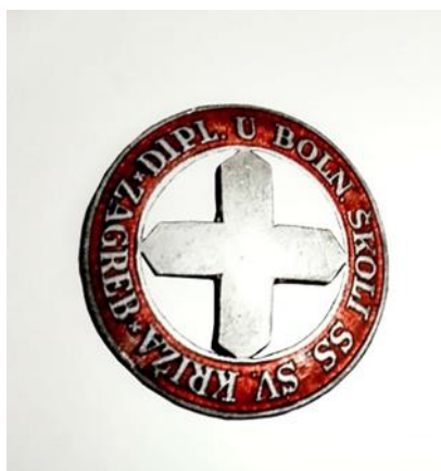
Slika 7. Broš bolničarki i redovnica

Broš se primjenjivao od 1922. godine, kada je završila i prva generacija sestara pomoćnica u Zagrebu. U prednjem dijelu broša nalazi se crveni križ koji okružuje natpis DIPLOM. SESTRA DRŽAVNE ŠKOLE S. P. ZAGREB. Broš je promjera 30 mm, a troškovi za izradu iznosili su 500 dinara.