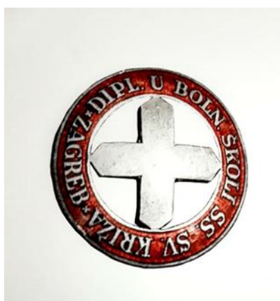
Slika 7. Broš bolničarki i redovnica

Broš se primjenjivao od 1922. godine, kada je završila i prva generacija sestara pomoćnica u Zagrebu. U prednjem dijelu broša nalazi se crveni križ koji okružuje natpis DIPLOM. SESTRA DRŽAVNE ŠKOLE S. P. ZAGREB. Broš je promjera 30 mm, a troškovi za izradu iznosili su 500 dinara.