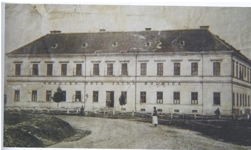
Slika 2. Novoizgrađena Gradska opća javna bolnica 1875.

Prema Husincu (13), uz dr. Kasumovića u koprivničkoj bolnici radi mnoštvo mladih liječnika, stažista i sekundarnih liječnika. Njegu bolesnika povjerio je časnim sestrama