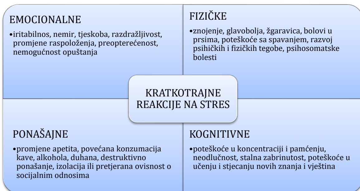
Tablica 5 Kratkotrajne reakcije na stres (prerađeno prema HZJZ (90))

Stres na radnom mjestu javlja se kao posljedica negativnog psihosocijalnog okruženja u kojem se rad odvija, odnosno javlja se zbog negativnih psiholoških, fizikalnih i socijalnih utjecaja u radnoj okolini na radnika (91). Nastaje kao posljedica nesrazmjera između zahtjeva posla i uvjeta rada te znanja, vještina, fizičkih i psihičkih karakteristika radnika.