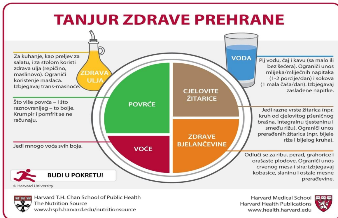
Slika 3. Tanjur zdrave prehrane. Preuzeto 22.04.2019. sa

https://www.hsph.harvard.edu/nutritionsource/healthy-eating-plate/translations/croatian/