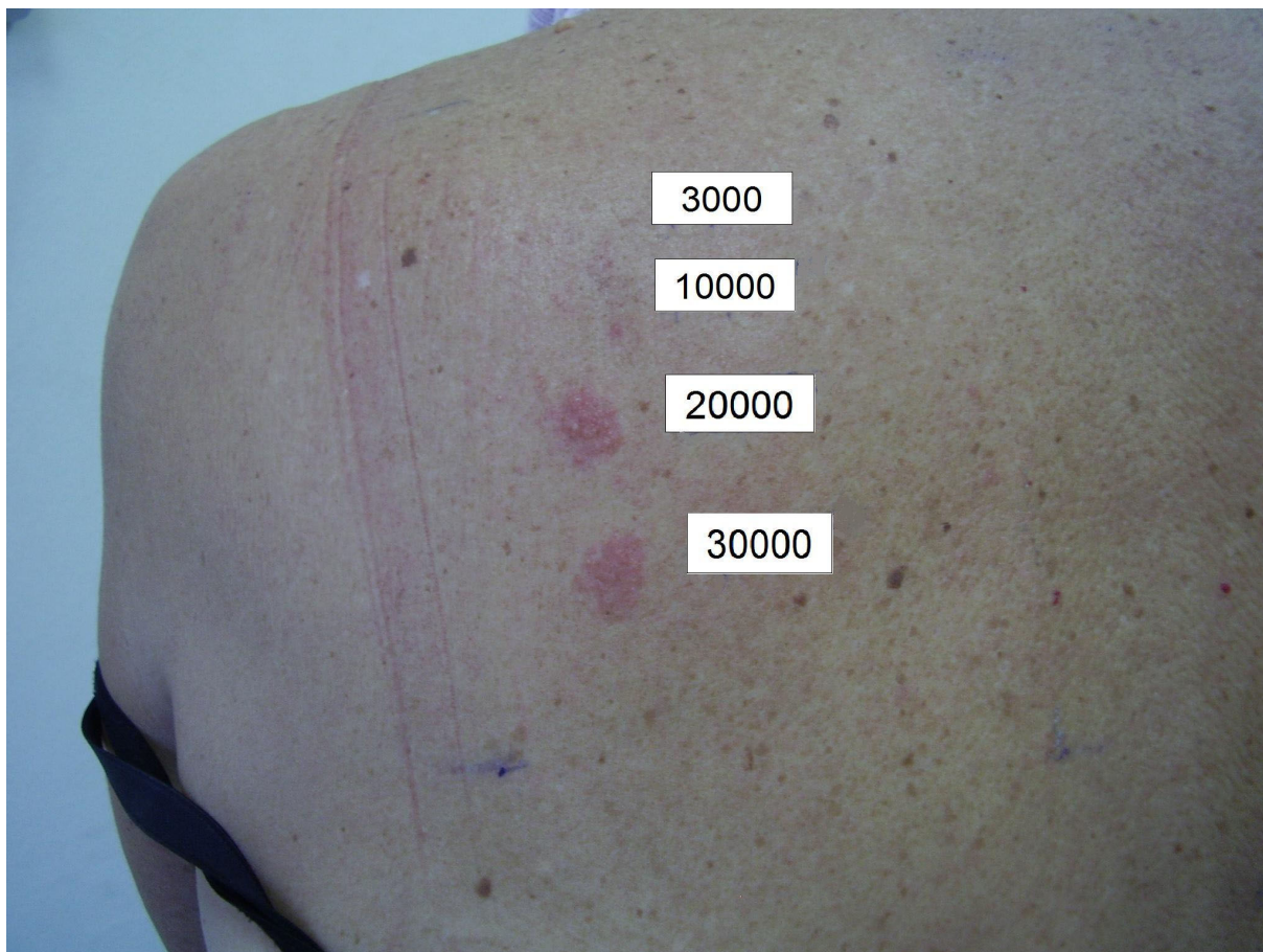
Slika 2. Pozitivan atopijski „patch“ test na koncentracije Dp 1 od 20000 i 30000 BJ/ml

Provokacijski testovi nisu rutinski dijagnostički postupci i mogu biti specifični i nespecifični. Specifični testovi izazivaju reakciju samo u senzibiliziranih osoba. Provokacijskim testovima izaziva se i objektivizira reakcija na alergen u određenom organu ili tkivu senzibilizirane osobe. Mogu biti nazalni, konjunktivalni i bronhalni (175). Pri alergiji na hranu može se koristiti ekspozicija potencijalnom alergenu ili eliminacijska dijeta s isključenjem potencijalnog alergena u trajanju od 1-4 tjedna.