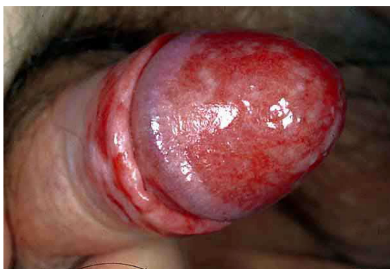
Slika 10. Oštro ograničeni eritem na glansu i prepruciju penisa uz madidaciju kod bolesnika s balanopostitisom.