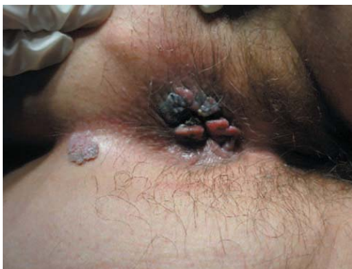
Slika 8 Anogenitalni kondilomi.

HPV (humani papiloma virus) je jedna od najčešćih virusnih spolno prenosivih infekcija. Incidencija HPV infekcija je u stalnom porastu u svijetu i ono što je zabrinjavajuće je da je incidencija bolesti najviša u dobnoj skupini od 18.-25. godine života, ujedno reproduktivno najpotentnijoj (120). Postoji preko 150 tipova HPV-a, od kojih su najčešći tipovi 6, 11, 16 i