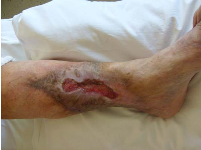
Slika 4. Ulkus s medijalne strane lijeve potkoljenice s okolnim bijelkastim i hiperpigmentiranim promjenama.

Naime, venski ulkus je kronična rana koja je posljedica kronične venske insuficijencije koja se klasificira u više stupnjeva. Brojni su klinički znakovi venske insuficijencije (88). Prva manifestacija su teleangiektazije u obliku mrežolikog kapilarnog crteža oko gležnjeva s osjećajem boli i težine u nogama. Sljedeća faza bolesti su dilatirane zmijolike tortuozne vene pod kožom. Kako u tom stadiju krv prelazi iz kapilara u potkožno masno tkivo, nastaje edem potkoljenica i hiperpigmentacija koja je posljedica ekstravazacije eritrocita i prelaska hemoglobina u hemosiderin. Moguća je fibroza subkutanog tkiva, tzv. lipodermatoskleroza. Najteži i krajnji oblik venske insuficijencije je venski ulkus.