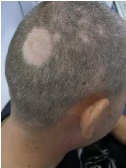
Slika 6 Alopecični areali u vlasištu parijetalno u bolesnika s alopecijom areatom.

povlače se u samoću i izbjegavaju socijalne kontakte što sve utječe na njihovu kvalitetu života.