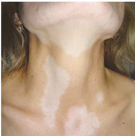
Slika 5. Depigmentirani areali na licu, vratu i pektoralno kod bolesnice s vitiligom.

Bolesnici s vitiligom ne osjećaju nikakve fizičke simptome bolesti, niti bolest ostavlja trajne posljedice po zdravlje, ali osjećaju psihosocijalni teret bolesti. Bolesnici su zabrinuti da će se depigmentirane promjene na koži širiti te da se pigment nikada neće vratiti zato su jako zainteresirani za liječenje svoje bolesti. Stigma bolesti prati bolesnike s vitiligom te utječe na njihovu percepciju bolesti i razvoj psihijatrijskih komorbiditeta (94).