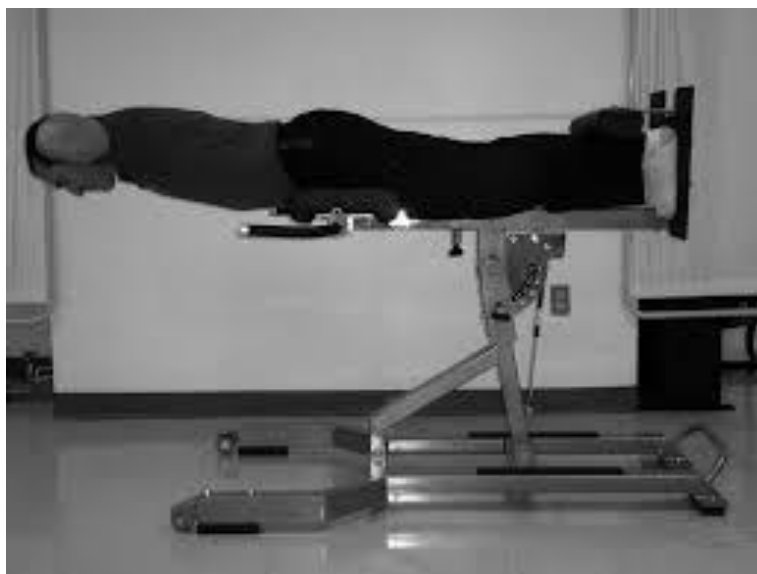
Slika 1: Prikaz Biering Sorensenovog testa za procjenu statičke jakosti ekstenzora trupa (66)

Mjerni postupak za provođenje motoričkog testa za procjenu statičke jakosti fleksora (pregibača) trupa testom „izdržaj u uporu na podlakticama“