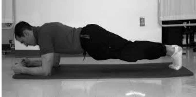
Slika 2: Prikaz testa za procjenu statičke jakosti fleksora trupa (66)