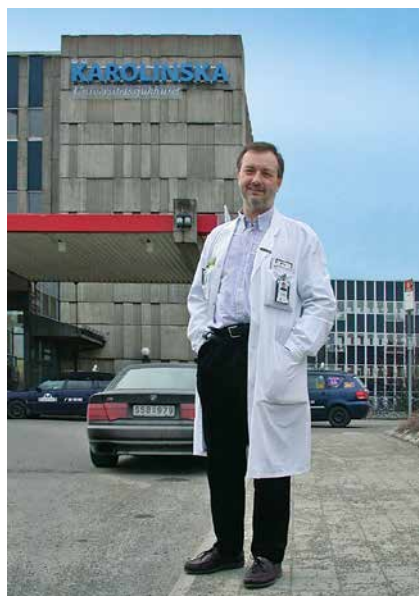
Ispred Karolinske bolnice 2006.

Prvi kritični trenutak kojega se sjećam bio je povezan s jednim tehničkim dostignućem tijekom moje prve godine u Švedskoj. Ništa posebno, ali ga se ipak sjećam jer mi je u tom trenutku mnogo značilo. U to vrijeme obavljao sam stereološke neurokirurške zahvate na Meynertovoj jezgri pokusnih životinja kako bi im smanjio kolinergičnu inervaciju mozga. Nakon operacije sam iz mozga napravio histološke rezove koje sam onda morao obraditi imunohistokemijski i na njima dokazati prisutnost enzima kolintransferaze. Laborantica, stručnjakinja za imunohistokemiju, pokušala je dokazati enzim, ali nije uspjela. Nakon nekoliko pokušaja zamolio sam ju da pokušam primijeniti svoje znanje iz Zagreba i da to učinim umjesto nje. Nakon nekoliko bezuspješnih pokušaja na kraju sam ipak uspio imunohistokemijski prikazati enzim u tkivu. Od silnog sam se uzbuđenja rasplakao. No sabrao sam se i zatim pokazao obojeno stakalce ostalim članovima grupe koji su mi čestitali na uspješno obavljenom poslu. Taj moj tehnički uspjeh donekle mi je poboljšao status unutar grupe, te sam preko noći od novopridošlog stranca postao redovnim članom laboratorija. Ujedno sam tada shvatio koliko mi je vrijedilo prethodno znanje doneseno iz Zagreba.