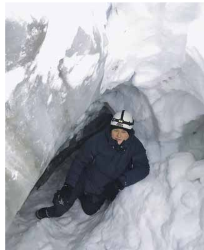
U dubinama ledenjaka na otoku Spitsbergen

interakcija mutiranog gena i APOE gena utječe na kliničko-morfološke značajke Alzheimerove bolesti. Na kliničkom planu izučavao sam razlike između Alzheimerove bolesti i demencije frontotemporalnog lobusa. Povezanost demencije i raznih poremećaja govora uvijek me zanimala i o tom sam problem napisao nekoliko radova.