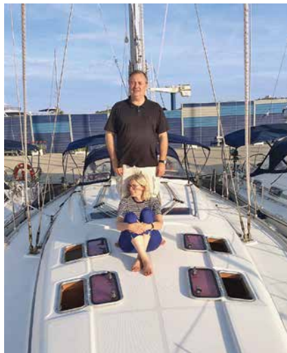
Sa svojom suprugom na ljetnim praznicima 2015.