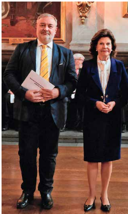
Sa švedskom kraljicom Silvijom na ceremoniji dodjele znanstvene potpore, 2023.

Ovih dana radim na karakterizaciji fibrilarnog oblika amiloida u krvi. To je dio naših istraživanja u kojima upotrebljavamo kompleksne nove fluorescentne probe za otkrivanje budućih biokemijskih biljega u krvi bolesnika koji imaju Alzheimerovu bolest. Za ovaj projekt sam, zajedno sa svojim suradnicima, dobio novčanu nagradu norveške fundacije Thon te financijsku potporu nekih švedskih znanstvenih i državnih zaklada.