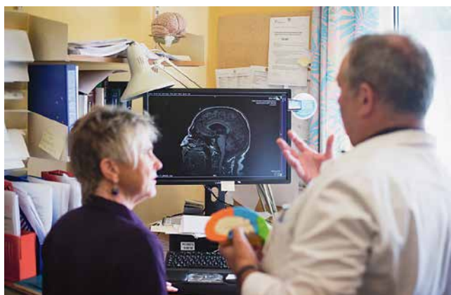
S pacijentom – objašnjavanje mozga, Oslo 2016.