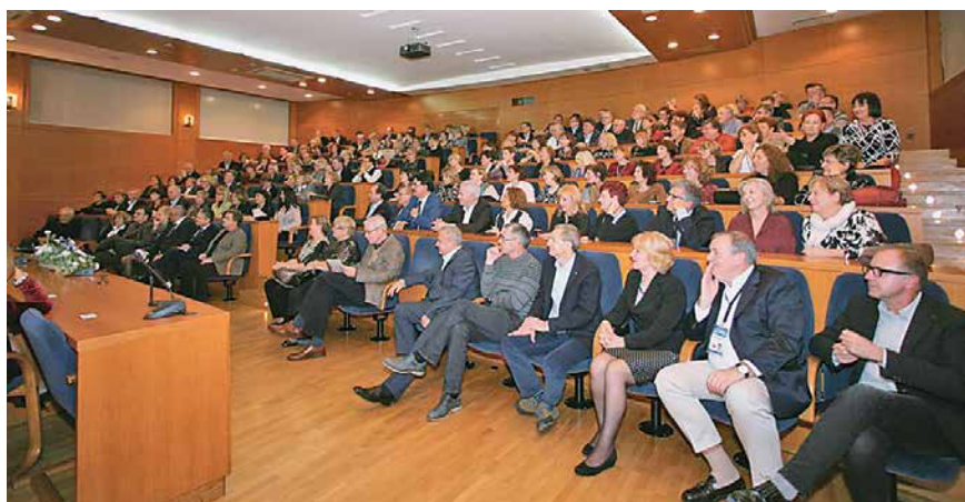
40-godišnjica generacije liječnika diplomiranih 1976., Hrvatski liječnički zbor 2016.

Jedan od glavnih ciljeva naše studentske organizacije bio je priprema skripta koje smo planirali tiskati na osnovi predavanja naših profesora. U to je vrijeme