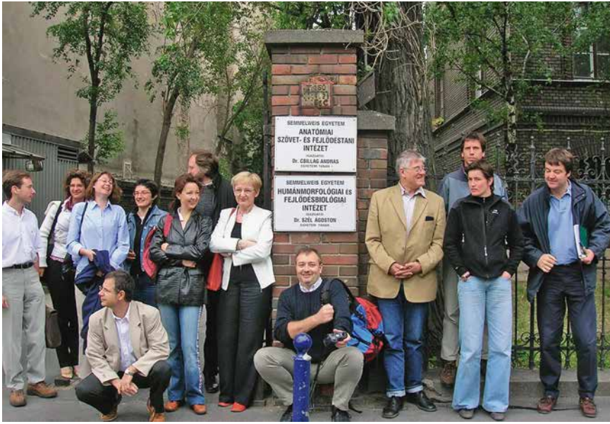
Znanstveni skup Brain Net Europe, Budimpešta 2005.