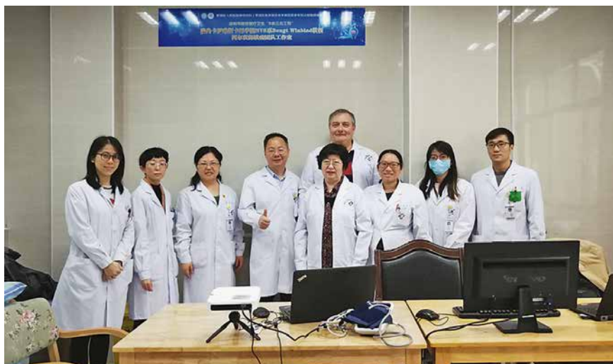
Na Neurološkoj klinici u Shenzenu, Kina, 2019.

Sudjelujem u dva velika projekta, BrainNet Europe i EUGMS. BrainNet Europe je stvoren kako bi tijekom 10 godina stvorio na 20 mjesta u Europi banke mozгова. Znanstvenici, kliničari i neuropatolozi iz raznih dijelova Europe radili su 10 godina na tom projektu i rezultate smo objavili u desetak radova. Glavna tema tih radova bila je standardizacija protokola za pregled mozgov a i usklađenje napora i poboljšanje komunikacije među sudionicima iz raznih zemalja. Glavni je cilj bio da