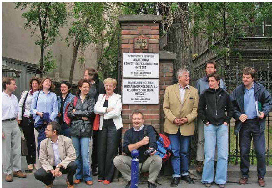
Znanstveni skup Brain Net Europe, Budimpešta 2005.