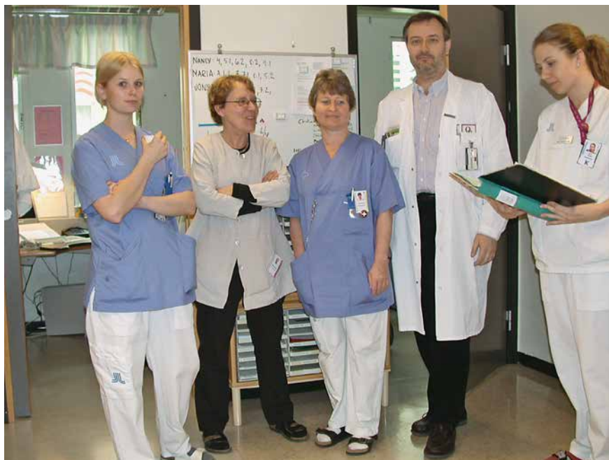
U mojem kliničkom odjelu 2006.

rali donijeti brzo – hoćemo li ostati ili ne. Najteže nam je pala pomisao da bismo na taj način morali ostaviti naše roditelje, ja i svoju sestru. Kako ostaviti Zagreb, naš grad, prijatelje, kolege i sve ono što smo imali u prethodnom životu? Profesionalno nije bilo problema jer sam imao zajamčen posao pa sam samo trebao nastaviti raditi na projektu koji sam bio započeo. No novi život u stranoj zemlji za moju cijelu obitelj nije bilo tako jednostavno zamisliti. Bez problema sam se uključio u švedski znanstveni i medicinski sistem. Ipak mi je trebalo vremena da se u cijelosti snađem i osamostalim na svojemu novom radnom mjestu. Trebalo mi je vremena da se počnemo sporazumijevati, da počnem shvaćati lokalne običaje, društvene konvencije i pravne detalje svoga zaposlenja. No sve u svemu, dobro je prošlo te smo sada postali dio njihovog društva.