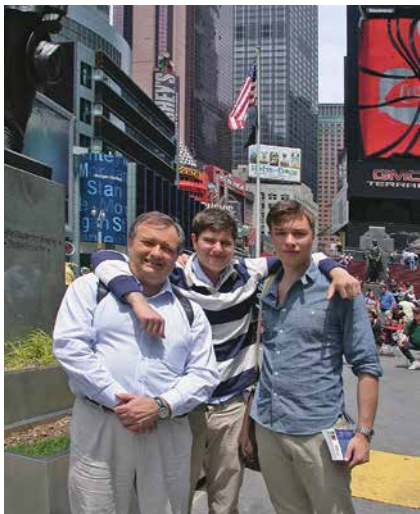
Sa svojim sinom 2011. u Velikoj Jabuci, gdje sam imao sjedište tvrtke