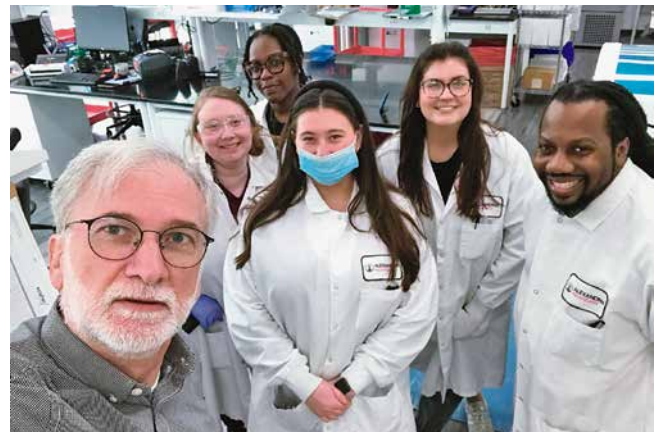
U laboratoriju tvrtke Scipher Medicine u Alexandria Center for Advanced Technologies, Research Triangle Park, North Carolina, 2023.

me dojke pa se od prvoga dana uključio u naša istraživanja. Skupio je mnoštvo podataka za svoj doktorat, a povrh toga je u suradnji sa mnom napisao i cijeli niz radova o toj vrsti tumora dojke. Naš zajednički rad na tu temu donio nam je brojna priznanja te su nas nakon toga pozivali da o tim tumorima držimo predavanja na raznim mjestima i na patološkim sastancima. Stručnjaci Svjetske zdravstvene organizacije (SZO) također su nas uočili pa su nas pozvali za suradnike u izradi petog izdanja njihove knjige o tumorima dojke. Nikad nisam ni pomislio da će me publikacija iz moje mladosti dovesti do toga da me stručnjaci SZO-a uvrste kao suradnika u tzv. "plavu knjigu", tj. dijagnostički priručnik koji SZO tiska u velikim nakladama za potrebe patologa širom svijeta.