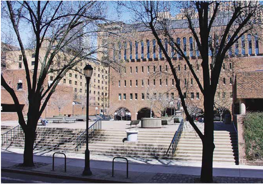
Thomas Jefferson University, Philadelphia. Počeo sam u laboratoriju kao poslijediplomski student 1990., a završio specijalizaciju iz patologije 1996. godine.