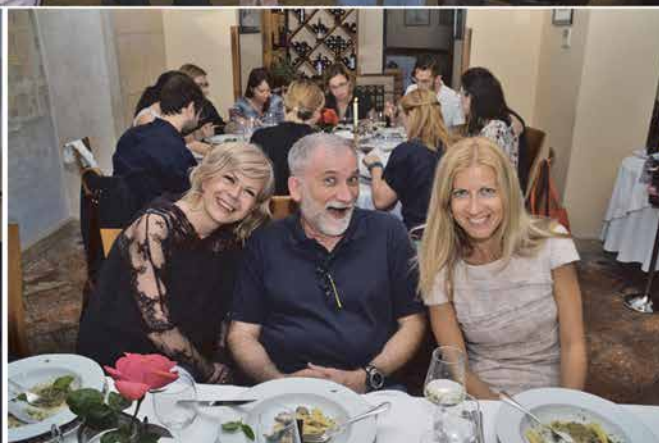
Nekoliko fotografija sa simpozija u čast Ljudevita Juraka, prvoga hrvatskog patologa, 2020. godine. Prilika da se obnove stara prijateljstva i stvore nova.