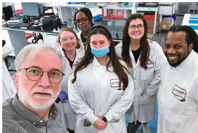
U laboratoriju tvrtke Scipher Medicine u Alexandria Center for Advanced Technologies, Research Triangle Park, North Carolina, 2023.

me dojke pa se od prvoga dana uključio u naša istraživanja. Skupio je mnoštvo podataka za svoj doktorat, a povrh toga je u suradnji sa mnom napisao i cijeli niz radova o toj vrsti tumora dojke. Naš zajednički rad na tu temu donio nam je brojna priznanja te su nas nakon toga pozivali da o tim tumorima držimo predavanja na raznim mjestima i na patološkim sastancima. Stručnjaci Svjetske zdravstvene organizacije (SZO) također su nas uočili pa su nas pozvali za suradnike u izradi petog izdanja njihove knjige o tumorima dojke. Nikad nisam ni pomislio da će me publikacija iz moje mladosti dovesti do toga da me stručnjaci SZO-a uvrste kao suradnika u tzv. "plavu knjigu", tj. dijagnostički priručnik koji SZO tiska u velikim nakladama za potrebe patologa širom svijeta.