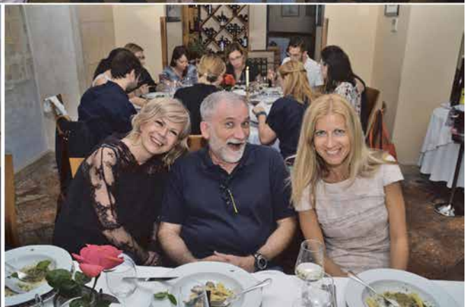
Nekoliko fotografija sa simpozija u čast Ljudevita Juraka, prvoga hrvatskog patologa, 2020. godine. Prilika da se obnove stara prijateljstva i stvore nova.