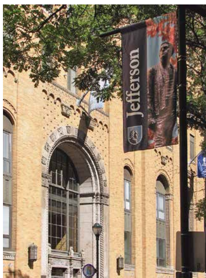
Europski kongres za onkologiju (ECCO-ESMO-ESTRO)

Ostvario sam timski rad. Imao sam sreću i privilegiju raditi s mnogo vrlo pametnih ljudi koji su bili predani svome poslu. Nije mi bilo teško predvoditi tim koji se sastojao od toliko sposobnih ljudi. Mislim da sam za sobom ostavio vrlo dobro organiziranu laboratorijsku službu. Činjenica da sam objavio mnogo znanstvenih radova pokazuje da sam bio dosta produktivan i kao znanstvenik.