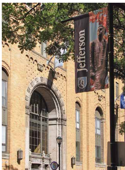
Europski kongres za onkologiju (ECCO-ESMO-ESTRO)

Ostvario sam timski rad. Imao sam sreću i privilegiju raditi s mnogo vrlo pametnih ljudi koji su bili predani svome poslu. Nije mi bilo teško predvoditi tim koji se sastojao od toliko sposobnih ljudi. Mislim da sam za sobom ostavio vrlo dobro organiziranu laboratorijsku službu. Činjenica da sam objavio mnogo znanstvenih radova pokazuje da sam bio dosta produktivan i kao znanstvenik.