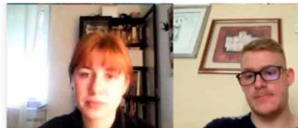
Slika 1. BBB učionica: kliničke vježbe na Dermatologiji

ulogu i bolesnika i moderatora. Na taj će način nastavnik moći preuzeti potpunu kontrolu nad provođenjem vježbe jer će simulirajući bolest imati i izravan nadzor nad radom studenata kojeg može korigirati kad to smatra potrebnim.