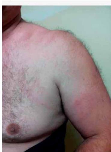
Pacijent 54 godina dolazi zbog crvenila koje se „širi“.

U modelu simuliranog bolesnika studenti komuniciraju direktno s „bolesnikom“, od kojeg uzimaju anamnezu i provode (ograničeni) fizikalni pregled. S obzirom na okolnosti i situaciju, trebalo je biti pragmatičan prilikom izbora simuliranog bolesnika. Najprije smo namjeravali predložiti da se angažiraju studenti-demonstratori koje bi uvježbali da simuliraju bolesnike. No ubrzo smo shvatili da to neće funkcionirati jer Fakultet nema dodatnog novca za toliki broj demonstratora. Zatim smo htjeli predložiti asistente s katedara jer bi njih bilo najlakše i najbrže uvježbati da simuliraju različite bolesnike, ali zbog njihove opterećenosti poslom ni to se nije pokazalo ostvarivim. Stoga je kao najjednostavnije i u ovom trenutku jedino moguće rješenje bilo predložiti voditelju vježbi da on istodobno preuzme