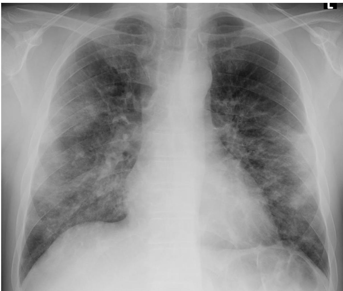
Slika 1. COVID-19 pneumonija – radiogram srca i pluća

klizanje, B-linije, preskačuće lezije i mala područja konsolidacija po tipu takozvanog „patchy“ uzorka s time da su stražnja plućna polja najčešće zahvaćena ovim navedenim promjenama. Progresija B-linija s pojačanom konsolidacijom na ultrazvuku govori u prilog pogoršavanja kliničke slike COVID-19 i moguće potrebe za intenzivnijom respiratornom potporom. 52,53