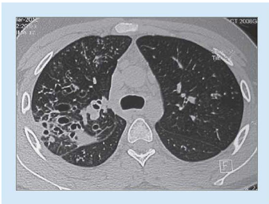
Slika 3. Radiološka slika ABPA (CT pluća)

Rentgen pluća može pokazati parenhimalne infiltrate i bronhiektazije, najviše u gornjim režnjevima pluća no svi režnjevi mogu biti zahvaćeni. (73) Na HRCT-u vidjet ćemo proksimalne cilindrične bronhiektazije koje se najviše mogu naći u gornjim režnjevima te zadebljanje bronhalnih zidova, ali i mukoidne čepove, atelektaze i područja uzorka tipa mliječnog stakla. (67) Također se mogu vidjeti centrilobularni noduli i grananje izgleda „tree-in-bud“. Ovisno o pronalasku abnormalnosti na HRCT-u, ABPA možemo klasificirati u ABPA-S (serološki ABPA), ABPA-B (ABPA s bronhiektazijama), ABPA-HAM (visoko razrjeđena sluz) i ABPA-CPF (ABPA s kroničnom pleuropulmonalnom fibrozom). Svi tipovi imaju kriterije za ABPA-u no kod ABPA-S se ne mogu pronaći abnormalnosti na HRCT-u, kod ABPA-B mogu se vidjeti bronhiektazije, kod ABPA-HAM ćemo pacijenti imaju povećanu produkciju sluzi, a kod ABPA-CPF vidljive su minimalno dvije abnormalnosti, uključujući fibrokavitacijske lezije, plućnu fibrozu i pleuralno zadebljanje, bez prisutnosti mukoidnih impakcija (HAM). (75)