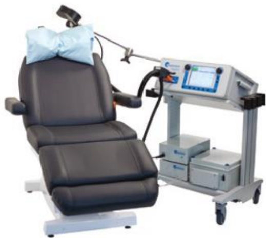
Slika 2. rTMS uređaj (26)

Konačno, rTMS također može potaknuti neuroplastične promjene u mozgu, što dovodi do dugotrajnih poboljšanja u raspoloženju i kognitivnoj funkciji. (28) Trenutno se rTMS primarno koristi kao terapijska opcija u odraslih osoba, no dokazana je djelotvornost i u ostalih dobnih skupina. (26)