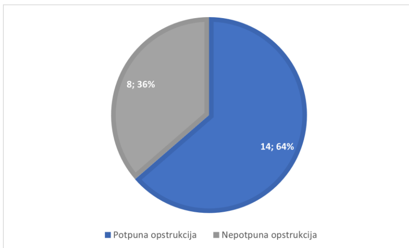
Slika 1. Grafički prikaz udjela novorođenčadi s potpunom intestinalnom opstrukcijom u odnosu na novorođenčad s nepotpunom opstrukcijom.

U ovome radu promatrano je 22 djece hospitalizirano u Klinici za dječju kirurgiju s dijagnozom intestinalne opstrukcije, od čega 12 ženske i 10 muške novorođenčadi. Slika 1. grafički prikazuje udio potpunih i nepotpunih opstrukcija među novorođenčadi. Zabilježeno je 64% slučajeva potpunih opstrukcija (n=14), dok je udio nepotpunih opstrukcija bio 36% (n=8). Opstrukciju na razini duodenuma imalo je 16 djece (atrezija duodenuma – 8, anularni pankreas – 3, stenozu duodenuma – 2, membrana duodenuma – 1, malrotacija i volvulus – 3). Jedno dijete je imalo uz anularni pankreas i atreziju duodenuma te je u statistici obje dijagnoze. Jejuno – ilealna opstrukcija je pronađena kod 6 novorođenčadi (atrezija jejunuma – 2, atrezija jejunuma i ileuma – 3, atrezija tankoga i debeloga crijeva – 1). Prosječna gestacijska dob ove novorođenčadi prilikom poroda je bila 35 tjedana.