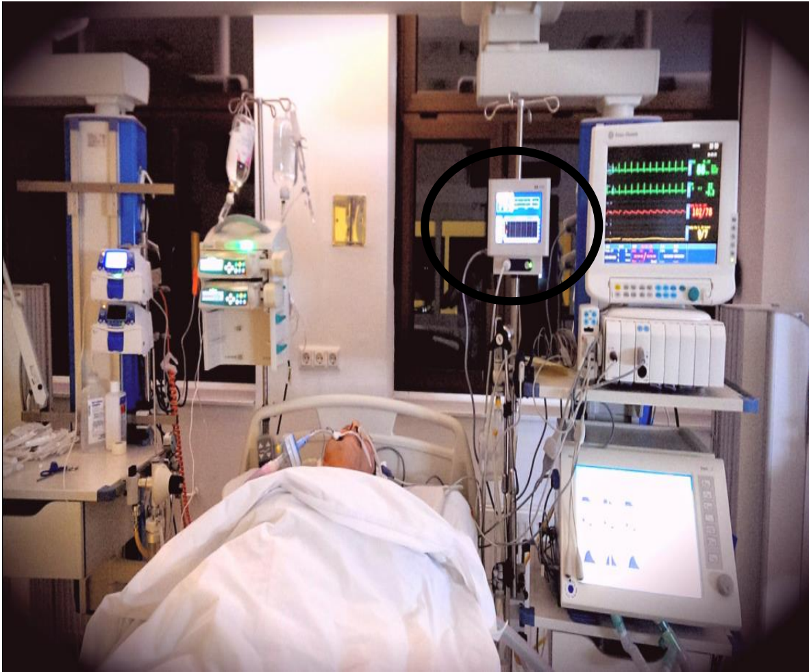
Slika 1. Uporaba bispektalnog indeksa u Jedinici intenzivnog liječenja Preuzeto: