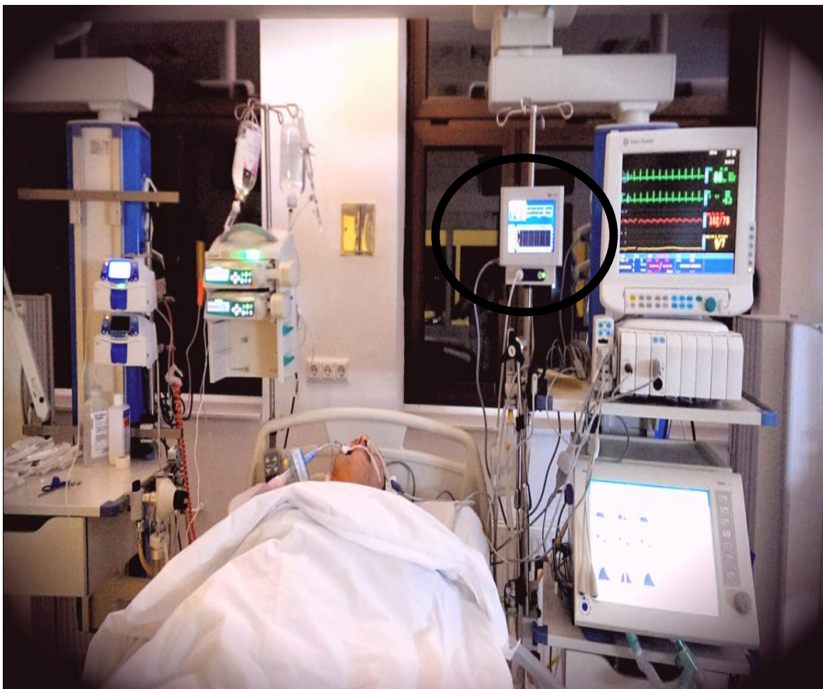
Slika 1. Uporaba bispektalnog indeksa u Jedinici intenzivnog liječenja Preuzeto: