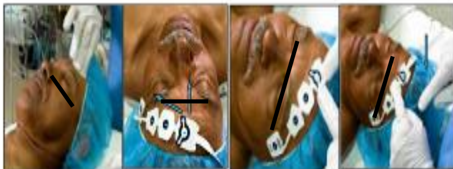
Slika 5. Postavljanje senzora

Korak 4 Pritisnite svaku brojku da ispusti gel koji se nalazi u njoj zbog bolje provodljivosti signala