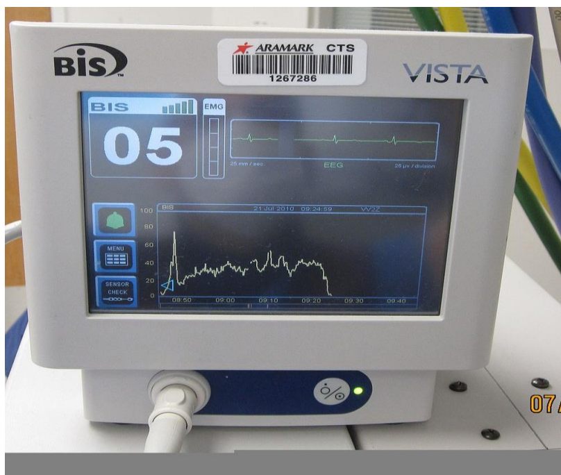
Slika 4. BIS monitor

Vrijednost BIS – a u realnom vremenu nastaje u tri koraka. U prvom koraku se EEG prije procesuiranja svaku sekundu raščlanjuje gdje se istovremeno prepoznaju i uklanjaju dijelovi koji sadrže smetnje. U drugom koraku se izračunava bispektralni indeks iz svojstava EEG – a. Posljedni korak je računanje postotka suprimiranog EEG – a iz dijelova EEG – a bez smetnji.