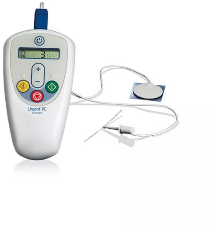
Slika 2. Uređaj za perkutanu stimulaciju posteriornoga tibijalnog živca (P-PTNS) (126)