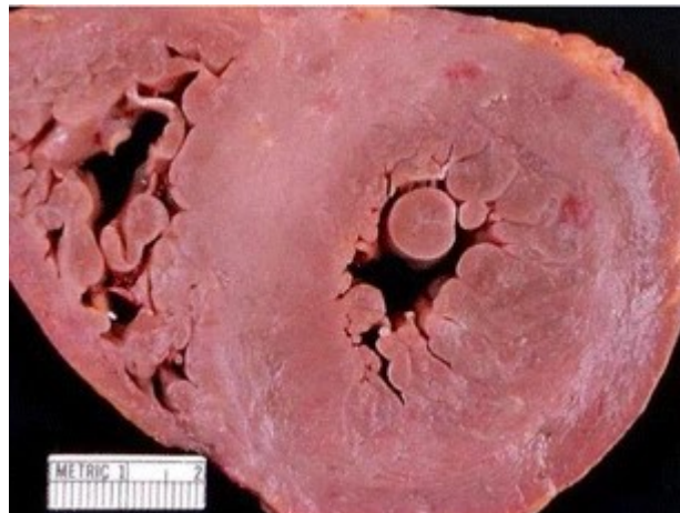
Slika 2. Hipertrofija miokarda (5).

Amiloidni depoziti na srcu uzrokuju u biti pseudohipertrofiju (slika 2), jer nakupljanjem depozita se povećava debljina miokarda zbog nakupljanja u izvanstaničnom matriksu, a ne zbog prave mišićne hipertrofije. Ejekcijska frakcija je u pravilu očuvana (4,5).