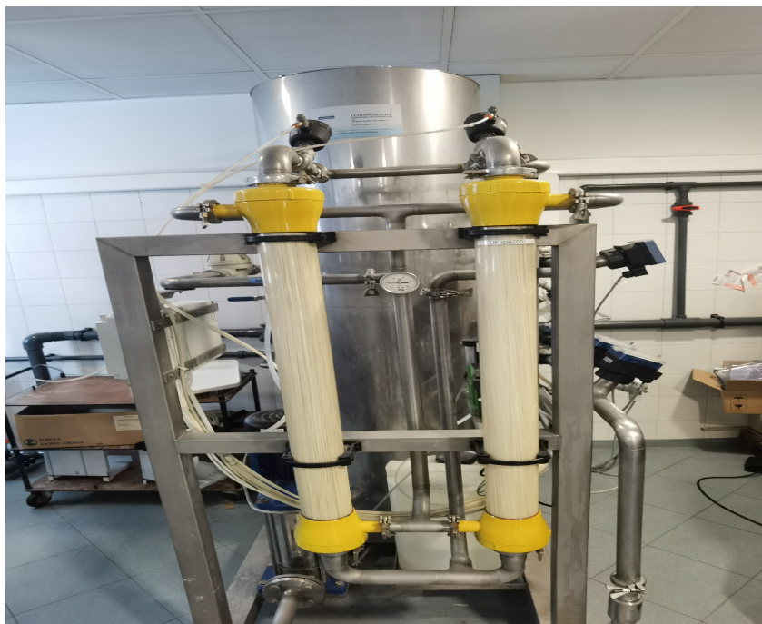
Slika 5. Endotoksinski filtar

Endotoksini, biofilm, mikroorganizmi iz vode se uklanjaju pomoću endotoksinskog filtra u kojem se odvija ultrafiltracija te metoda vruće toplinske dezinfekcije.