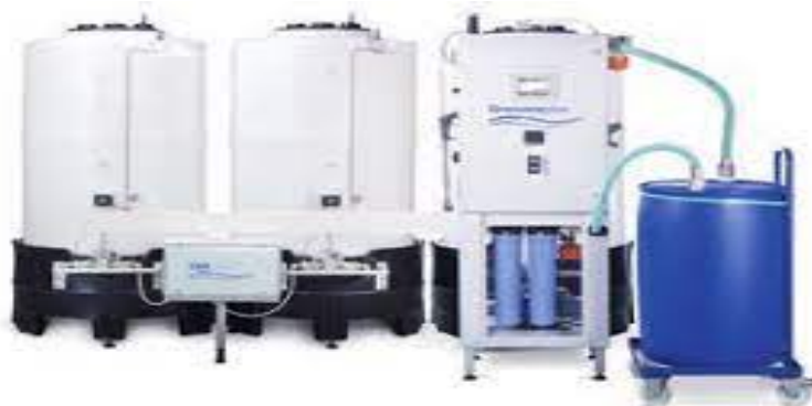
Slika 6. Sustav za pripremu i distribuciju vode www.freseniusmedicalcare.com.co

Nakon što vodovodna voda prođe sve navedene postupke od reverzne osmoze do nekoliko vrsta filtracije ona postaje ultra čista. Takva ultračista voda u postrojenju za pripremu vode miješa se s kiselim dijelom dijalizata te kreće u distribuciju do priključnih mjesta uređaja za dijalizu.