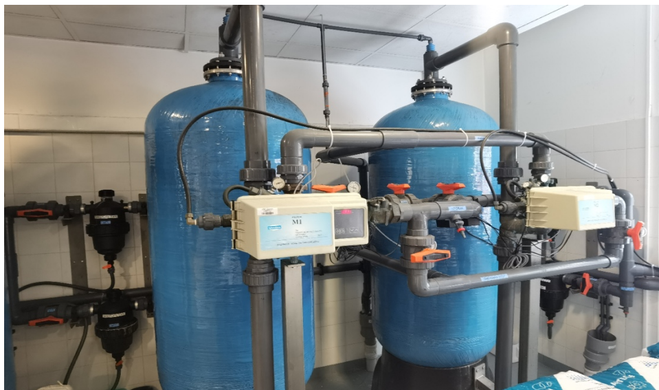
Slika 4. Uređaj za aktivnu filtraciju.

Kako bi bolesnik bio zaštićen od derivata klora koji mogu uzrokovati hemolizu ili rezistenciju na eritropoetin te kako ne bi došlo do štetnog djelovanja na membranama reverzne osmoze u seriju se postavljaju dva karbonska ležaja s obzirom na mogućnost njihovog iscrpljivanja (16).