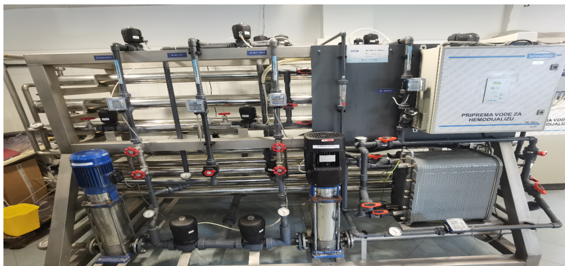
Slika 5. Uređaj za reverznu osmozu

Reverzna osmoza je metoda koja osigurava kontinuiranu opskrbu kemijski i mikrobiološki apirogene izlazne demineralizirane vode (16).