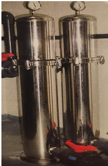
Slika 3. Mikrofiltracija

Dijaliza Kliničkog bolničkog centra Zagreb po broju pacijenata najveća je u Republici Hrvatskoj, posjeduje vlastito postrojenje za pripremu vode. Postrojenje za pripremu vode sastoji se od kaskadnog slijeda koji čine komponente predtretmana, glavna jedinica za pročišćavanje te sustav za dodatno pročišćavanje.