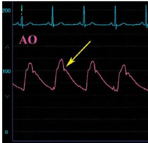
Slika 1 Prikaz krivulje arterijskog tlaka. Prema: Ragosta (2008) str:27.