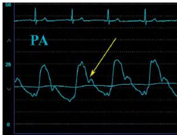
Slika 3 Tlak u plućnoj arteriji. Prema: Ragosta (2008) str:22.

Hemodinamski profil pacijenata može se karakterizirati mjerenjem intravaskularnog tlaka. Kada se sumnja na tamponadu srca moguće je povećanje venskog tlaka i tlaka okluzije plućne arterije. Potrebno je izmjeriti miješana venska krv kako bi se odredio MV, koji je nizak ako je prisutna tamponada. Sumnja na disfunkciju desnog srca postavlja se u slučaju kada se izjednače lijeva i desna strana tlakova i ako je tlak u desnoj pretklijetki veći od tlak okluzije plućne arterije. Plućna hipertenzija je znak povećanja postopterećenja desne klijetke (plućna embolija, primarna ili sekundarna plućna hipertenzija), a za postavljanje dijagnoze se koristi kateter plućne arterije (2).