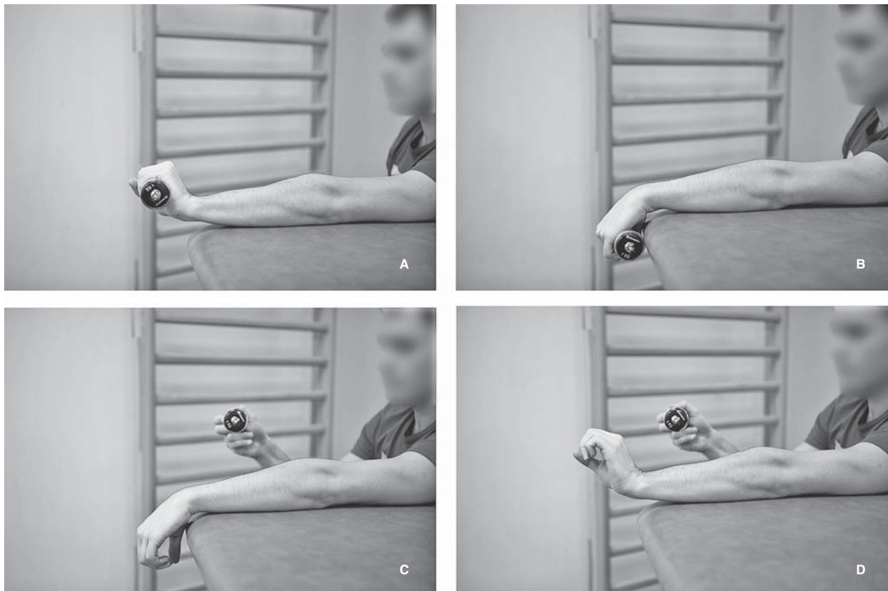
Slika 3. Prikaz izvođenja ekscentrične vježbe u liječenju lateralnog epikondilitisa. A) Osoba sjedi pokraj stola tako da je ruka koja se liječi zbog lateralnog epikondilitisa, u ovome slučaju lijeva, potpuno ispružena u laktu i oslonjena na stol. Ruka je u položaju pune pronacije, a ručni je zglob u položaju maksimalne ekstenzije, dok je uteg čvrsto stisnut u šaci. B) Iz tog se položaja ručni zglob savija prema dolje, tj. čini se palmarna fleksija šake. To je spuštanje ekscentrična faza vježbe pa je od iznimne važnosti da se ta kretanja izvede vrlo polako, tj. da traje najmanje 4 do 5 sekundi. C) U trenutku kad se dostigne najveća moguća palmarna fleksija šake, osoba drugom, slobodnom rukom prihvaća uteg te ga izvuče iz šake ruke kojom čini ekscentričnu vježbu. D) Nakon što se u ruci koja se liječi zbog lateralnog epikondilitisa više ne nalazi uteg, osoba ekstendira ručni zglob te se na taj način ručni zglob vraća u početni položaj. Ovaj dio ekscentrične vježbe nije potrebno izvoditi polako.

Figure 3. Eccentric exercises for the treatment of lateral epicondylitis. A) The person is sitting by the table, with the arm being treated for lateral epicondylitis, in this case the left one, fully extended in the elbow and on the table. The arm is fully pronated, with the wrist in maximum extension and the person is holding the weight tightly in the fist. B) From that position the person lowers the fist i.e. palmar flexion is done. This lowering is the eccentric phase of the exercise so it is of utmost importance that it is done very slowly, for at least 4 or 5 seconds. C) When the maximal palmar flexion is achieved, the person reaches for the weight with the other, free hand and takes the weight from the arm with which he does the eccentric exercise. D) After the arm being treated for lateral epicondylitis is weight-free, the person does wrist extension, so that the wrist is raised to the start-position. For this part of the eccentric exercise it is not important to do it slowly.