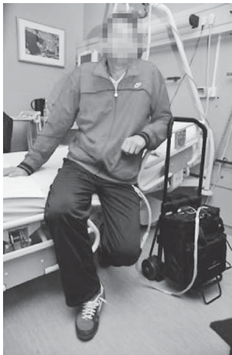
Slika 2. Bolesnik s prijenosnom konzolom za kontrolu rada uređaja LVAD

U listopadu 2008. godine ponovljenom invazivnom obradom utvrđena je progresija bolesti te je tada EF LK 15–20% uz mitralnu regurgitaciju III. angiostupnja. Na kardiološko-kardiokirurškom konziliju razmotrena je mogućnost daljnjeg liječenja te je zbog napredovanja zatajivanja srca (NYHA IV; engl. New York Heart Association functional class ), indicirana ugradnja mehaničke potpore lijevoj klijetki (LVAD; engl. left ventricular assist device ) kao potpora do transplantacije srca. Kirurški zahvat obavljen je uspješno, uz uredan postoperativni oporavak bolesnika. Za antikoagulantnu terapiju rabili smo varfarin redovito kontrolirajući INR (engl. international normalized ratio ), uz ciljani raspon vrijednosti od 2,5 do 3,5 te antitrombocitnu terapiju acetilsalicilnom kiselinom od 150 mg na dan. Nakon ugradnje mehaničke potpore kliničko stanje bolesnika postupno se poboljšavalo, uz subjektivni oporavak. Kontrolna ehokardiografija pokazala je porast EF LK od 32%, uz dobru kontrakciju stražnje stijenke i neznčajnu mitralnu regurgitaciju. Bolesnik je krajem prosinca 2008. godine potpuno mobiliziran te u hemodinamski i ritmički stabilnom