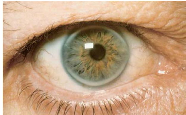
Slika 3. Arcus corneae u bolesnika s porodičnom hiperkolesterolemijom Figure 3. Corneal arch in a patient with familial hypercholesterolemia

svrstava među češće nasljedne genske metaboličke poremećaje. 6 Procjenjujemo da je u Hrvatskoj 8000–9000 bolesnika s ovom bolesti, većina ih je neprepoznata i stoga neliječena te imaju velik rizik od ranog razvitka kardiovaskularnih bolesti i smrti. 7 Najčešći uzrok bolesti je mutacija na genu za receptor lipoproteina niske gustoće (LDL – low density lipoprotein ) koji se nalazi na 19. kromosomu i dugačak je 45 kb, a čini ga 17 eksona. 8 Do sada je, prema registru prijavljenih mutacija pri Centru za kardiovaskularnu genetiku, UCL, London, Ujedinjeno Kraljevstvo, opisano oko 1100 mutacija. 9 Zbog navedene mutacije dolazi do funkcijske pogreške LDL-receptora zbog čega LDL-čestice bogate kolesterolom ne mogu biti unesene i razgrađene u stanicama, poglavito jetre. Posljedično one se nagomilavaju u krvi te dolazi do povećanja količine ukupnog i LDL-kolesterola.