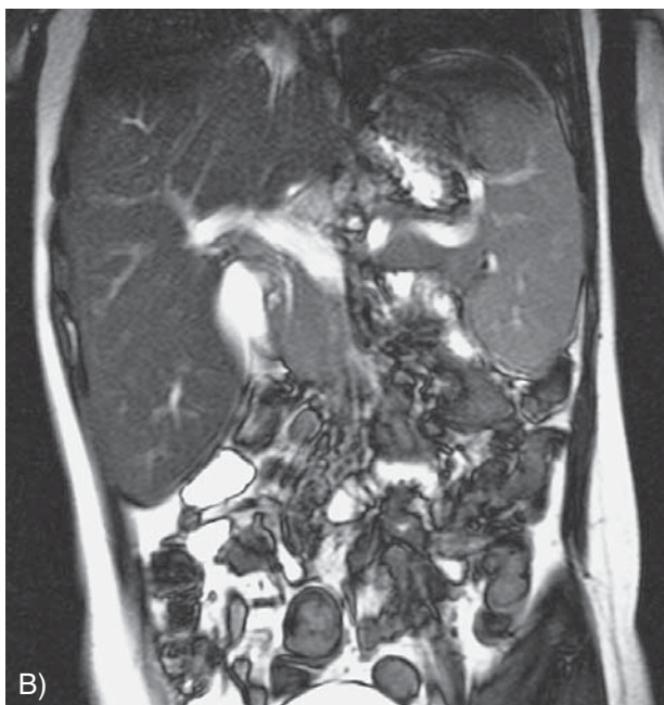
Figure 4. Abdomen MRI showing hepatosplenomegaly in a patient suffering from cholesterol ester storage disease, axial (A) and coronal scan (B)

skih estera nerijetko oligosimptomatska i često nespecifična, od koristi su svakako i laboratorijski nalazi. Bolesnici gotovo uvijek imaju povišene aktivnosti aminotransferaza, i to od blagog povišenja do stotruko većih vrijednosti od gornje granice referentnog raspona. 6 Vrlo često imaju povišeni ukupni kolesterol i LDL-kolesterol, a nizak HDL-kolesterol, što je posebno indikativno u bolesnika koji nisu pretili. 6,14 Kao i u ostalim lizosomskim bolestima nakupljanja može se naći povišena aktivnost hitotriozidaze u serumu. 15,16 Međutim, treba voditi računa da oko 5% populacije ima prirodni manjak hitotriozidaze i da niska aktivnost tog biomarkera ne isključuje postojanje lizosomske bolesti. 17 Od šire dostupnih dijagnostičkih metoda koristan je i ultrazvučni nalaz steatohepatitisa, odnosno masno promijenjene jetre. Prema vrijedećim smjernicama Američkoga gastroenterološkog društva iz 2012. godine ultrazvučni nalaz masno promijenjene jetre (engl. NAFLD, non-alcoholic fatty liver disease ) u malog djeteta ili djeteta koje nema prekomjernu tjelesnu težinu i druge znakove metaboličkog sindroma, uz ostalo (što uključuje virusni hepatitis, Wilsonovu bolest, lipodistrofiju, abetalipoproteinemiju, toksični učinak lijekova, parenteralnu prehranu, poremećaj razgradnje masnih kiselina i karnitinskog ciklusa itd.) zahtijeva i obradu u smjeru bolesti nakupljanja kolesterolskih estera. 18