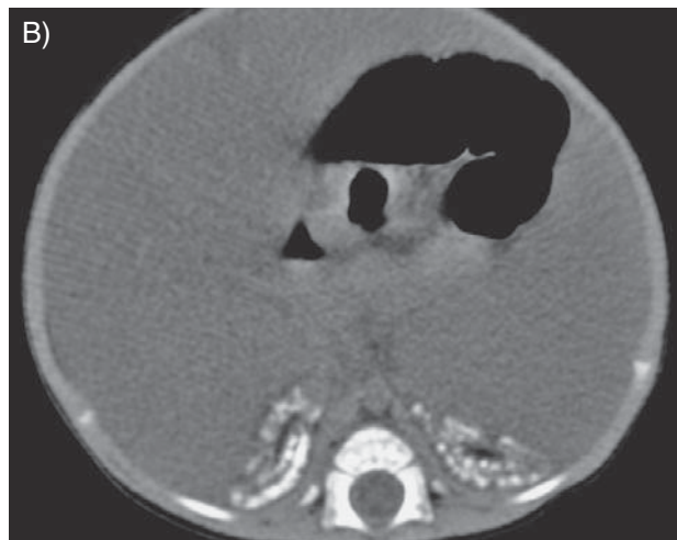
Slika 2. Obostrane kalcifikacije nadbubrežnih žlijezda prikazane na rendgenogramu (A) i kompjutoriziranoj tomografiji (B)

Figure 2. Bilateral adrenal calcifications shown by conventional radiography (A) and computed tomography (B)