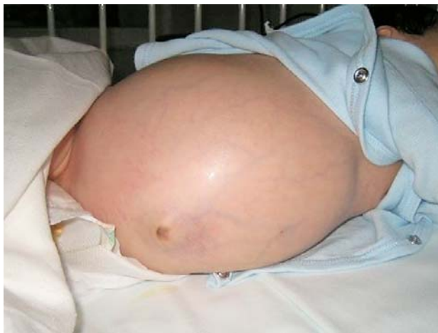
Slika 1. Distenzija trbuha, pojačan venski crtež i hepatosplenomegalija u dojenčeta s Wolmanovom bolešću

Figure 1. Abdominal distension, enlarged veins and hepatosplenomegaly in an infant suffering from Wolman disease