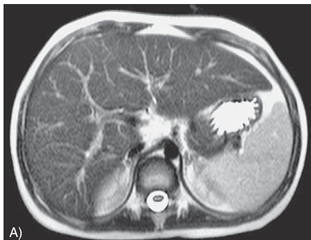
Slika 4. MR abdomena u bolesnice s bolesti taloženja kolesterolskih estera koji pokazuje uvećanu jetru i slezenu, aksijalni (A) i koronarni presjek (B)

Figure 4. Abdomen MRI showing hepatosplenomegaly in a patient suffering from cholesterol ester storage disease, axial (A) and coronal scan (B)