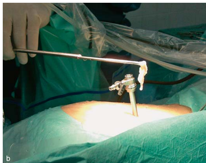
Slika 3. a i b. Prikaz rada s endoskopom (a) i odstranjenog sekvestra intervertebralnog diska (b) Figure 3. a and b. Image of work with endoscope (a) and removed sequestered intervertebral disc (b)