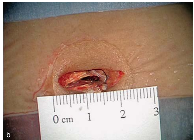
Slika 2. a i b. Prikaz sustava tubularnih reaktora (a) i veličine kožnog reza (b) Figure 2. a and b. Image of tubular refractor system (a) and size of the skin flap (b)