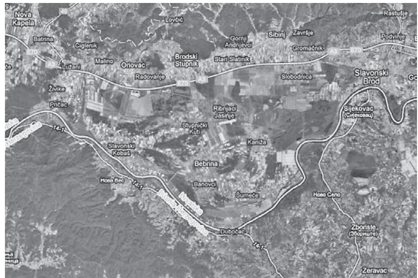
Slika 1. Endemsko žarište u Hrvatskoj Figure 1. Endemic focus in Croatia

života u određenom podneblju jest tzv. prvi prirodni pokus s Ukrajinacima. 3 Naime, prije stotinjak godina, nakon revolucionarnih previranja u carskoj Rusiji u ovo su se područje naselili Ukrajinci. Oni koji su se naselili u endemsko područje i prihvatili način života autohtonog stanovništva oboljevali su jednakom učestalošću kao i starosjedioci. Oni koji su se naselili izvan endemskih sela nisu oboljevali češće od kronične bubrežne bolesti nego u općoj populaciji. Osim toga EN nije nikada zabilježen u Ukrajinaca koji su nastavili živjeti u Ukrajini.