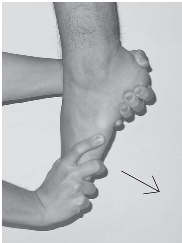
Slika 2. Test hiperplantarne fleksije kojim se potvrđuje ili odbacuje dijagnoza SSSG-a. Strelica pokazuje smjer u kojem ispitivač potiskuje stopalo u plantarnu fleksiju

Vodeći simptom SSSG-a jest bol koja je lokalizirana u stražnjem dijelu gležnja, i to u dubljim dijelovima, neposredno iza talusa, a ispred Ahilove tetive. 2 Bol nije stalno prisutna, već se javlja samo u trenutku kada je stopalo u maksimalno izvodiivoj plantarnoj fleksiji, kao što je to primjerice u baletnim položajima en pointe i demi pointe ili pak prilikom udaranja lopte dorzumom stopala, odnosno