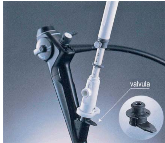
Slika 1. Prikaz endobronhalnog ultrazvuka i punkcijske igle (BF-UC160F-OL8, Olympus, Tokio, Japan i XNA-202C; Olympus, Tokio, Japan)

Figure 1. Proximal et distal part of the endobronchial ultrasound with aspiration needle (BF-UC160F-OL8, Olympus, Tokyo Japan & XNA-202C; Olympus, Tokyo, Japan)