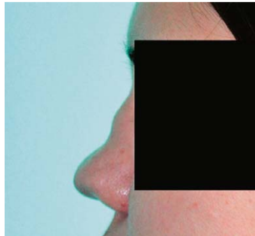
Slika 1. Sedlasta deformacija nosa u bolesnice s GPA Figure 1. Saddle-nose deformity in GPA

Od laboratorijskih nalaza izdvajamo granično pozitivna protutijela na MPO 5 U/mL (normalne vrijednosti < 5 U/mL). Protutijela na PR-3, antinuklearna protutijela (ANA) i protutijela na dvostruku uzvojnica DNA (anti ds-DNA) bila su negativna, a vrijednosti C-reaktivnog proteina (CRP), sedimentacije eritrocita, C3 i C4-komponente komplementa bile su uredne. Marker virusnih hepatitisa B i C bili su negativni, kao i anti-HIV. Nalaz sedimenta urina bio je uredan, a vrijednost 24-satne proteinurije bila je u fiziološkim granicama. Ostali učinjeni laboratorijski parametri bili su u granicama referentnih vrijednosti.