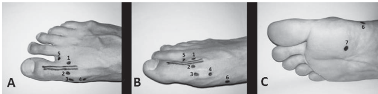
Slika 1. Artroskopski ulazi koji se rabe prilikom artroskopije prvoga metatarzofalangealnog zgloba: 1. dorzolateralni ulaz; 2. dorzomedijalni ulaz; 3. medijalni ulaz; 4. proksimalni medijalni ulaz; 5. ulaz toe web; 6. medijalni plantarni ulaz; 7. plantarni ulaz

Figure 1. Arthroscopic portals for arthroscopy of the first metatarsophalangeal joint: 1 – dorsolateral portal; 2 – dorsomedial portal; 3 – medial portal; 4 – proximal medial portal; 5 – toe web portal; 6 – medial plantar portal; 7 – plantar portal.