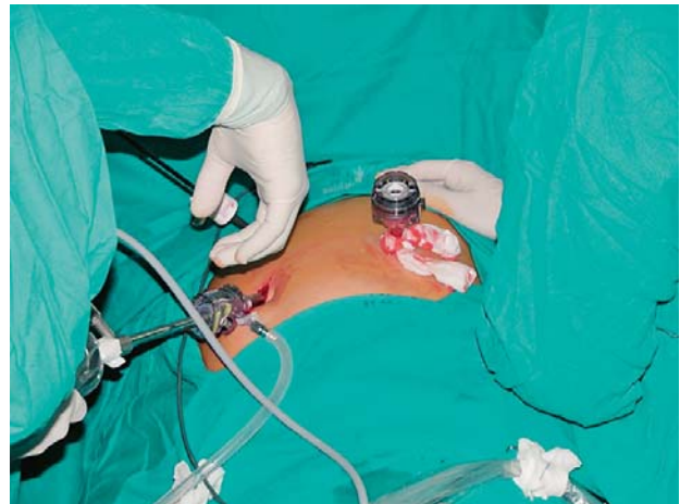
Slika 1. Položaj bolesnika i troakara za vrijeme laparoskopije splenektomije

Upotrijebili smo deskriptivne statističke metode. Krivulja odgovora napravljena je prema Kaplan-Meierovoj