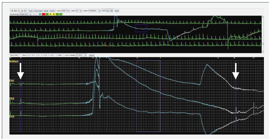
SLIKA 1. ASISTOLIČKA PAUZA U TRAJANJU OD 25,3 SEKUNDE (STRJELICE) TIJEKOM EPILEPTOGENE SINKOPE S VEGETATIVNOM SIMPTOMATOLOGIJOM U 26-GODIŠNJE BOLESNICE (SLUČAJ 1.)

FIGURE 1. ASYSTOLIC PAUSE LASTING FOR 25.3 SECONDS (ARROWS) DURING EPILEPTOGENIC SYNCOPE WITH VEGETATIVE SYMPTOMATOLOGY IN A 26-YEAR-OLD PATIENT (CASE 1)