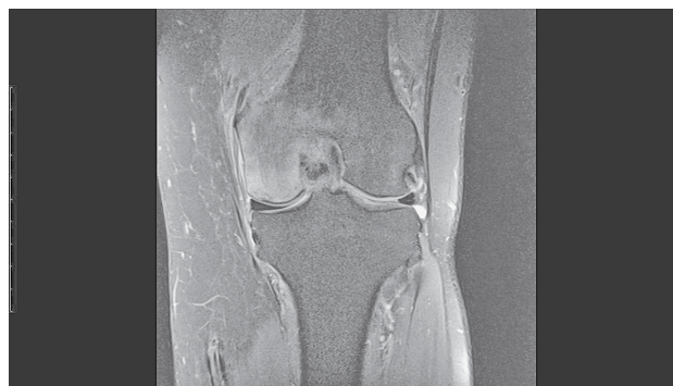
SLIKA 1. MAGNETSKA REZONANCA LIJEVOG KOLJENA (KORONARNI PRESJEK, FAT-SATURATED PROTON-DENSITY WEIGHTED SEKVENCA) NA KOJOJ SE VIDI EDEM KOŠTANE SRŽI I INFRAKCIJA SUBHONDRALE KOSTI MEDIJALNOG KONDILA FEMURA, ŠTO UPUĆUJE NA SPONTANU OSTEONEKROZU KOLJENA

Nakon kliničkog pregleda uvijek valja načiniti standardnu radiološku obradu koljena. 4,40 Dok u početnom stadiju SONK-a najčešće nema nikakvih znakova oštećenja, u kasnijim se stadijima javljaju karakteri-