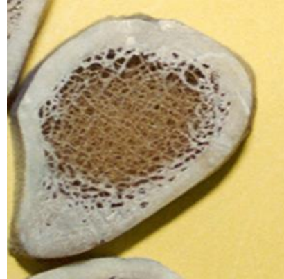
Slika 2. Uzorak bioloških tragova (kost)