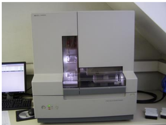
Slika 5. 3100-Avant Genetic Analyzer

Podaci i analiza genotipa se dobivaju prosječno svakih 30 minuta obrade tako što laser detektira fluorescentno označene uzorke DNA kada prođu kroz prozor detekcije. Velika prednost ove metode je što se ne iskoristi sav uzorak DNA tako da se postupak može ponoviti, a i nije potrebno nikakvo predznanje o kapilarnoj elektroforezi da bi se mogla izvoditi ova analiza (Butler, 2001.).