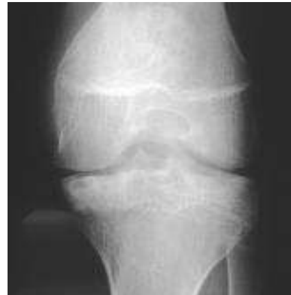
Slika 4 Koljeno u pacijenta s hemofilijom. Stadij 3 prema Arnold-Hilgartnerovoj klasifikaciji hemofilične artropatije