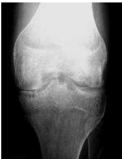
Slika 5 Koljeno u pacijenta s hemofilijom. Stadij 4 prema Arnold-Hilgartnerovoj klasifikaciji hemofilične artropatije