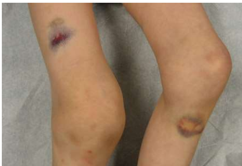
Slika 2 Akutna hemartroza desnog koljena s ekhimozama, preuzeto s https://online.epocrates.com/u/2911468/Hemophilia/Summary/Highlights

Hemartroza (Slika 2) je klinički znak teškog oblika hemofilije i najčešći je tip krvarenja u djece s hemofilijom. Iako su svi sinovijalni zglobovi u potencijalnoj opasnosti, najčešće su zahvaćeni koljena, laktovi i gležnjevi. Raspon dobi u kojem dijete doživi prvu epizodu krvarenja u zglob strahovito varira. U nizozemskoj studiji, srednja dob prvog krvarenja u zglob je 1.8 godina, a raspon dobi je od 0.2 do 5.8 godina. (van Dijk, 2005) Varijacije u dobi u kojoj djeca s teškim oblikom hemofilije dožive svoju prvu epizodu krvarenja u zglob odražava značajnu heterogenost koja postoji u fenotipu krvarenja u pacijenata s teškim oblikom hemofilije. Moguća objašnjenja predložena za takvu heterogenost su: razlike u razini fizičke aktivnosti, u strukturnoj cjelovitosti zgloba i prisutnost protrombotskih stanja, posebice mutacije faktora V Leiden. (Carcao, 2012; Franchini, 2009; van Dijk, 2004)