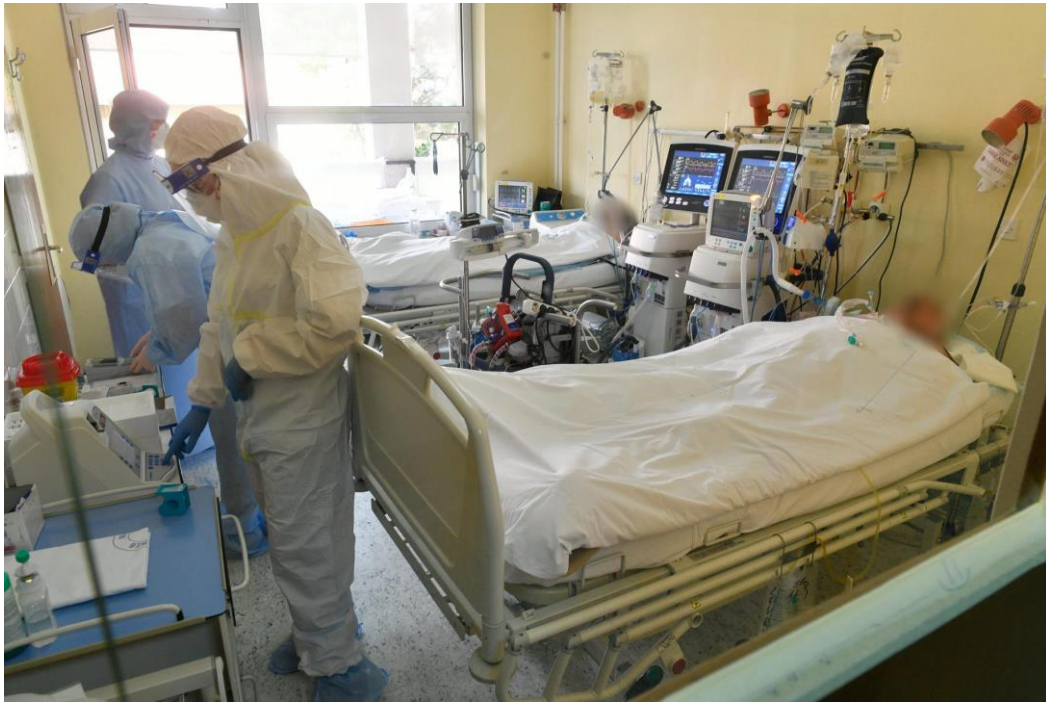
Slika 3. Jedinica intenzivnog liječenja za COVID-19 u Klinici za infektivne bolesti „Dr. Fran Mihaljević“ u Zagrebu.

Medicinske sestre igraju ključnu ulogu u informiranju i organizaciji unutar bolnice. One izvještavaju i sudjeluju na sastancima kako bi educirale kolege o novim protokolima i smjernicama te dijele svoje iskustvo. Njihova komunikacijska vještina i organizacijske sposobnosti pomažu u smanjenju napetosti i stresa te imaju ključnu ulogu u prenošenju znanja i iskustava u svim situacijama. Svojim predanim radom i posvećenošću, medicinske sestre pridonose boljoj skrbi za bolesnike u izazovnim vremenima.