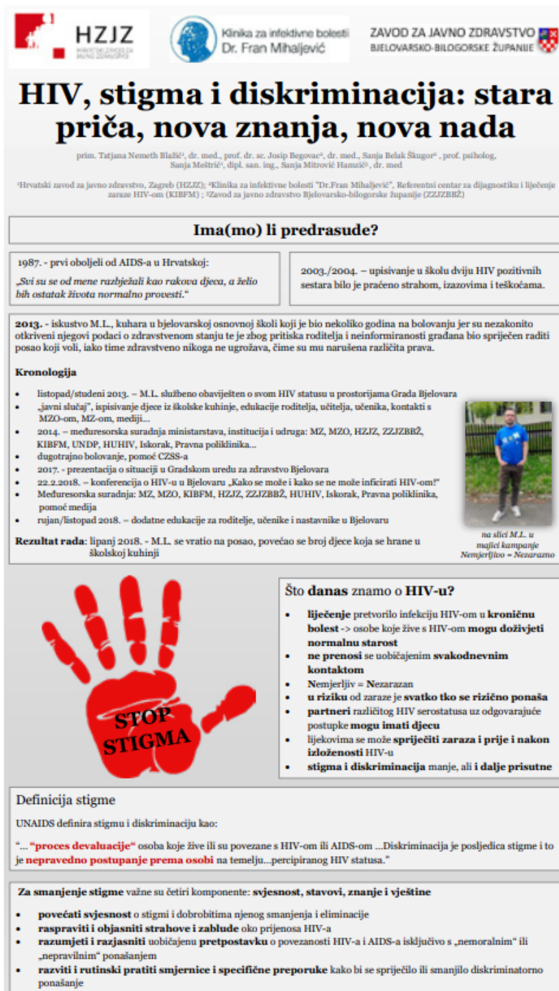
Slika 3. Poster „HIV, stigma i diskriminacija: stara priča, nova znanja, nova nada“

nazivom „HIV, stigma i diskriminacija: stara priča, nova znanja, nova nada“ autora Blažić T.N., Begovac J., Belak Škugor S., Meštrić S. i Mitrović Hamzić S (70).