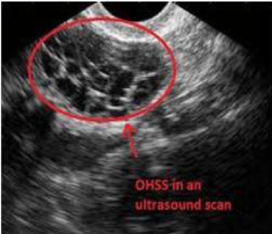
Slika 1. OHSS na ultrazvuku. Vidi se povećan jajnik ispunjen cistama.